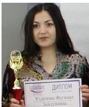
Узденова Ф.З. «Разработка ПЦР набора для выявления генома вируса бешенства».