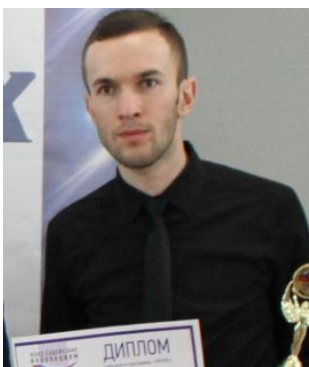
Байказиев А.Э. «Гибридный полимер-неорганический нанокompозит на основе ароматического простого полиэфира и органоимодифицированного бентонита-Э».