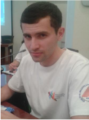
Шонтуков Э.З. «Разработка технологии вертикальной культуры томата с использованием светодиодных систем досвечивания растений».