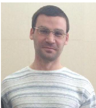
Бжихатов К.Ч. «Создание сверхтонких функциональных нанослоев методом межфазной