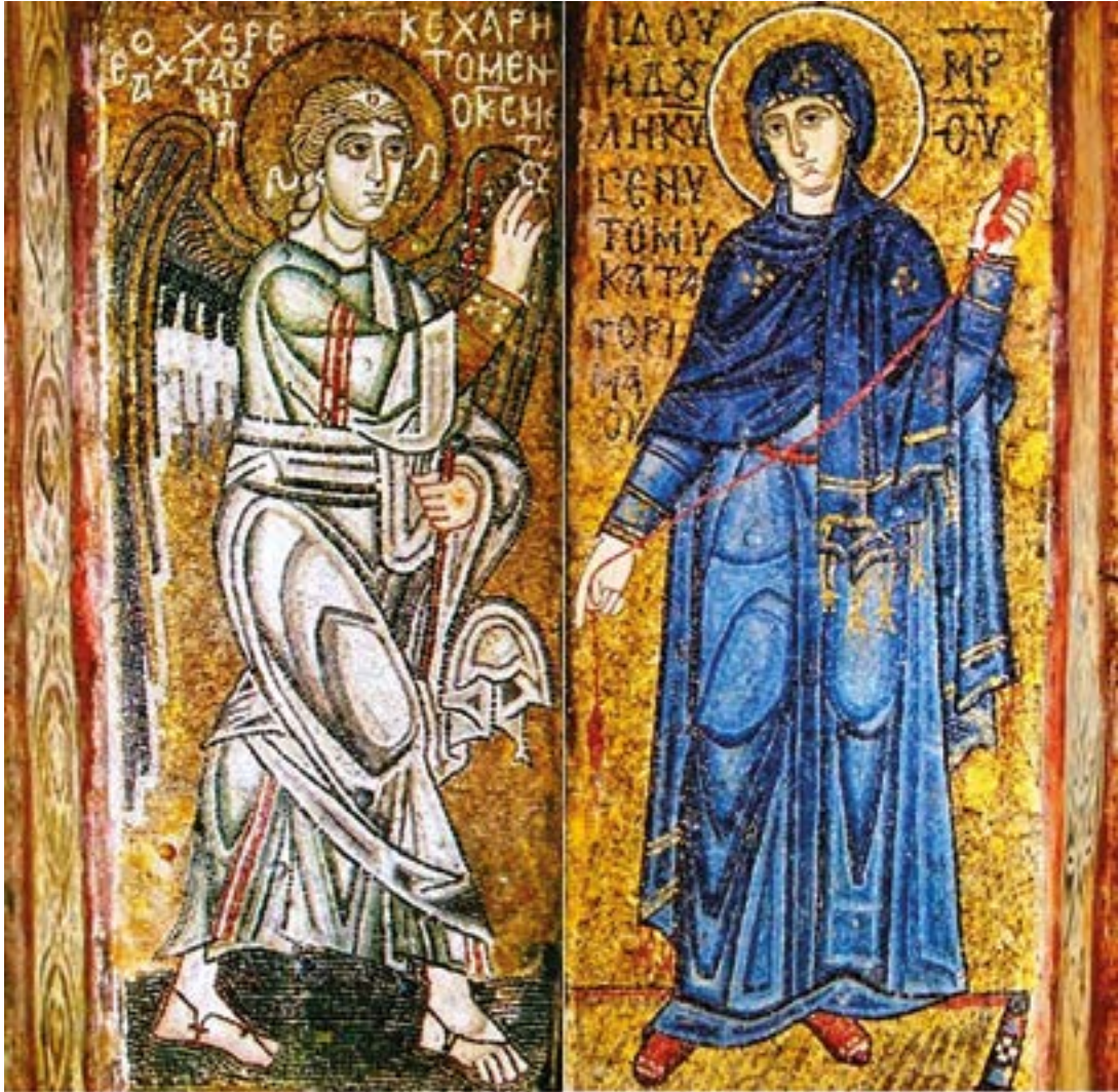
Благовещение Пресвятой Богородицы. Мозаика. Около 1037 года. Совмещенные фрагменты на алтарных столбах. Софийский собор. Киев.

Дѣва днесь Пресущественнаго раждает, и земля вертеп Непреступному приносит, Ангели с пастырьми славословят, волсви же со звездою путешествуют: нас бо ради родися // Отроча Младо, Превечный Бог.