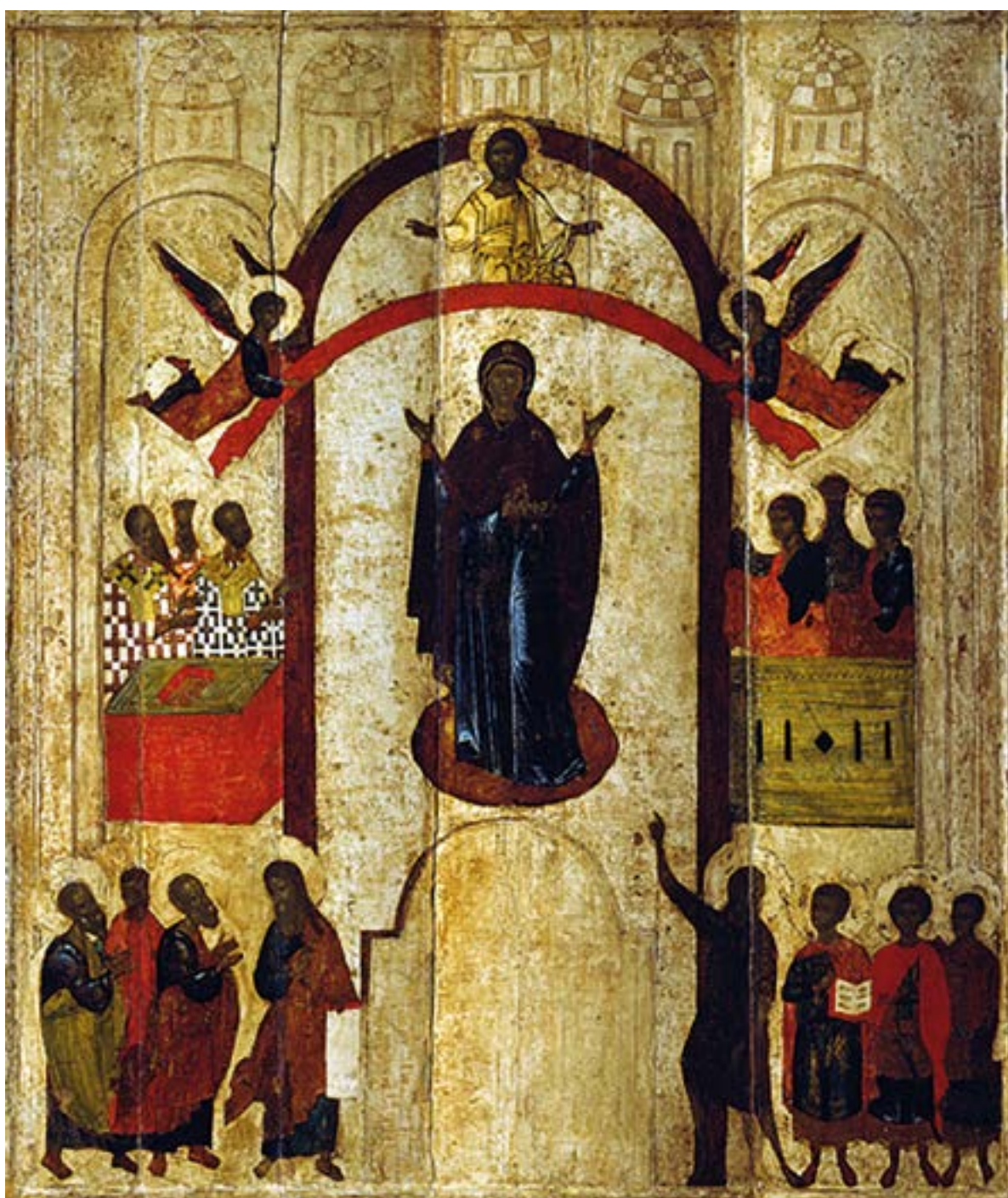
Икона Покрова Пресвятой Богородицы. 1399 год. Зверин-Покровский монастырь. Великий Новгород. Новгородский государственный историко-архитектурный и художественный музей-заповедник.

Тебѣ припадаем, Госпожѣ, вѣрою и, покланяющесе, благодарно вопиѣм Ти: радуйся, Богоблагодатная Дѣво, покрове, и ограждѣние наше, и Помощнице в бѣдѣ сущим, спаси нас, к Тебѣ прибегающих, на Тя бо надѣемся.