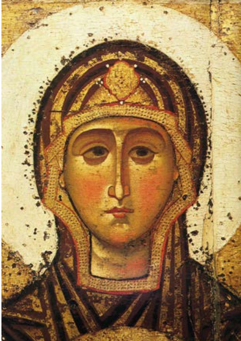
Икона Божией Матери «Великая Панагия» («Оранта» (Молящаяся)). Первая треть XIII века. Фрагмент.

«Без чистоты тела и сердца никто не может быть совершен перед Богом» (Преподобный Антоний Великий). «...Чистота сердечная, т. е. блюдение и охранение ума... все страсти и всякое зло отсекает от сердца и искореняет из него и вместо того вводит в него радость, благонадежие, сокрушение, плач, слезы, познание себя самих и грехов своих, памятование смерти, истинное смирение, безмерную любовь к Богу и людям и божественное рачение сердечное» (Преподобный Исихий Иерусалимский).