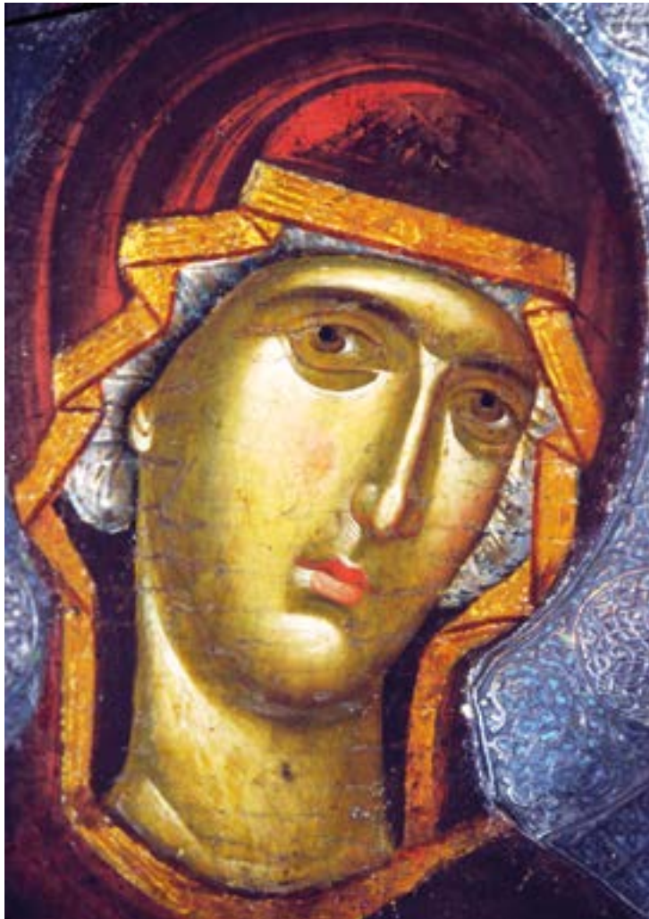
Икона Божией Матери «Душеспасительница» (Психосострия). 1312–1325 годы. Византия. Фрагмент. Национальный музей. Охрид. Македония.

О, всепéтая Мати, Пречíстая Госпоже́, Дéво Богорóдице! К Тебе́ возвождú душе́вныя и телéсныя очи, к Тебе́ простираю разсла́бленныя рúце и из глубины́ сёрдца вопию́: призри на véру и смире́ние души́ моея́, покры́й мя всемо́щным омо́фором Твоимъ, да избáвлюся от все́х бéd и напа́стей.