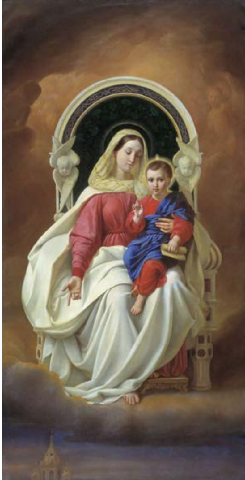
Алексей Тарасович Марков. «Богоматерь с младенцем». 1849 год. Государственный Русский музей. Санкт-Петербург.

Велича́ем Тя,/ Живода́вче Христé,/ / нас ра́ди ныне плóтию Ро́ждшагoся/ / от Безневе́стных/ и Пречи́стыя Дéвы Мари́и.