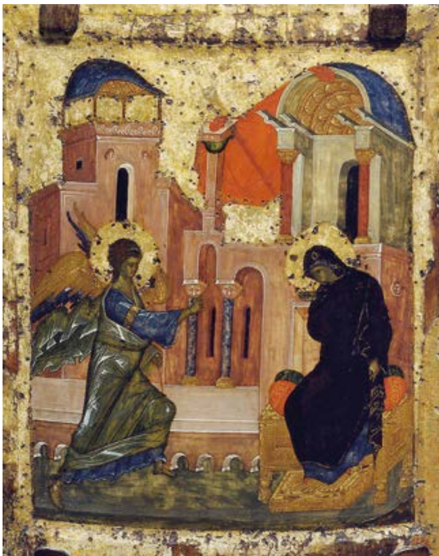
Икона Благовещения Пресвятой Богородицы. Конец XIV века. Византия. Государственная Третьяковская галерея. Москва.

Богородица , Богомáтерь, Дéва Мари́я, Пресвята́я Дéва, Мадóнна (третья четверть I века до н. э.) — земная мать Иисуса Христа, одна из самых почитаемых личностей и величайшая из христианских святых, Богородица (Матерь Божия), Царица Небесная (лат. Regina Coeli ). В Библии нет упоминания термина «Богородица», а Мария называется по имени. Согласно Евангелию (Мф. 1:16–25; Лк. 1:26–56; 2:1–7), она была галилеянкой, девушкой из Назарета, обрученной Иосифу, которая, будучи девственницей, зачала своего Сына Иисуса чудесным образом, посредством Святого Духа.