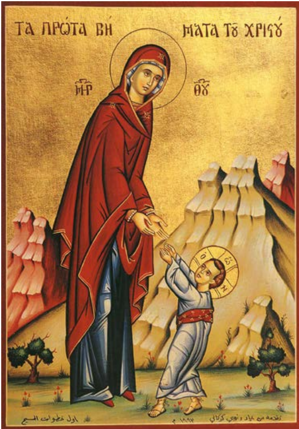
Икона Божией Матери «Первые шаги Иисуса Христа». Иерусалим. Израиль.

о своей семье и родных (1 Тим. 5:8,16). Апостолы и предстоятели несут заботу о церквях (2 Кор. 11:28; Флп. 2:20; 1 Тим. 3:5), а церкви, в свою очередь, заботятся о мужах, служащих им (Флп. 4:10). Но всегда существует опасность впасть в чрезмерную, по сути своей, эгоистическую заботу о ближних (1 Кор. 7:32–34); за такими заботами человек перестает внимать Богу и не ищет Его воли (Лк. 10:41 и след.). (Библейская энциклопедия Брокгауза. Ф. Ринкер, Г. Майер. 1994 г.).