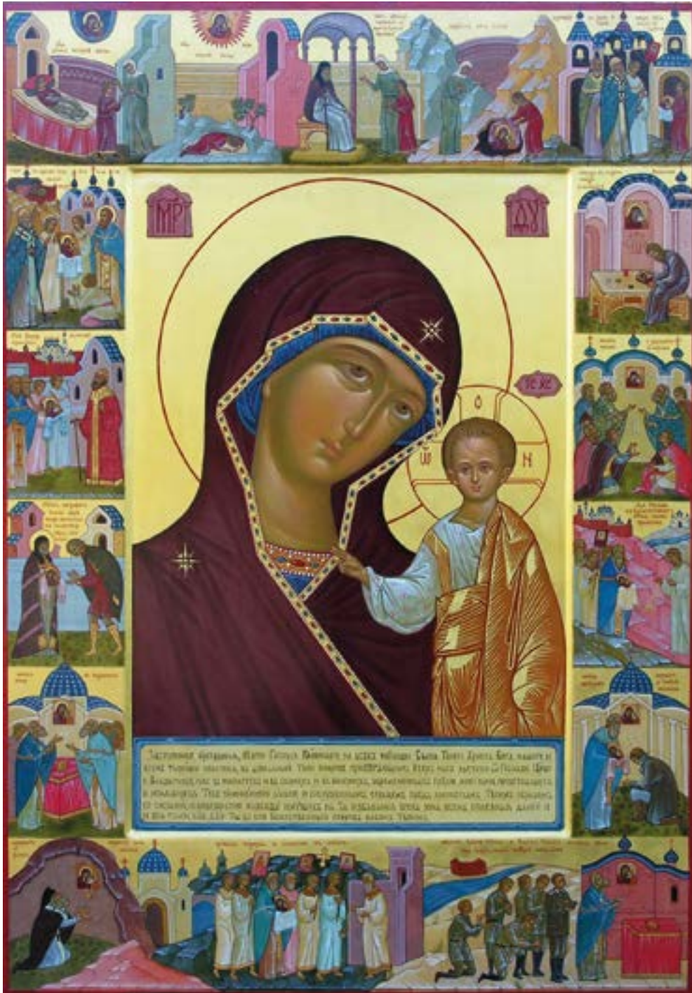
Казанская («Сталинградская») икона Божией Матери. XXI век.

Ты же, яко Всемилостивая, всех притекающих к Тебе Помощнице, заступай нас во всех скорбех и нуждах, бедах и напастех, да зовем Ти: Радуйся, Заступнице усердная рода христианского!