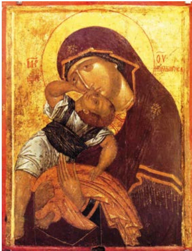
Икона Божией Матери «Взыграние младенца». Византия.

Поскольку мать, родившая детей, ухаживала за ними, воспитывала их, то она связана с ними особенно сильно; она не может забыть их (Ис. 49:15; 66:13; 1 Фес. 2:7) и заботится об их жизни, содержании и преуспевании (Агарь (Быт. 21:16; Исх. 2:2–9); настоящая мать ребенка, принесенного на суд Соломона (3 Цар. 3:26,27); мать сыновей Зеведеевых (Мф. 20:20,21)). Библия предписывает оказывать почтение и послушание матери во все дни ее жизни, так же как и отцу (Исх. 20:12; 21:15,17; Притч. 1:8; 23:22; Мф. 15:4–6; Еф. 6:2,3). Естественно, мать оказывает большое влияние и на духовное развитие ребенка, на его склонность к добру или злу (благое влияние Ревекки на Иакова (Быт. 27); Анны — на Самуила (1 Цар. 1,2); Евники — на Тимофея (2 Тим. 1:5); напротив, злое влияние Иродиады на дочь (Мк. 6:24,25)). Материнская привязанность наблюдается и у животных (Исх. 22:30; Лев. 22:27). Отношение матери к своим детям служит образом любви Божьей к Его народу (Ис. 44:1,2; 66:13).