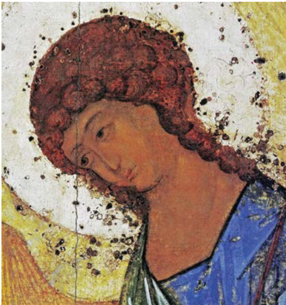
Икона «Троица». Святой преподобный Андрей Рублев. 1411 год. Фрагмент. Троицкий собор. Троице-Сергиева лавра. Икона написана «в похвалу Сергию Радонежскому» по заказу его ученика и преемника игумена Никона. Государственная Третьяковская галерея. Москва.

Дух из Бога, сочетавшись с душою животною, возвел ее на степень души человеческой. И стал человек двояк. Одно тянет его к Небу, другое — к земле. Когда человек в своем чине держится, то он живет духом, т. е. страхом Божиим водится, и совести слушается, и горнего ищет.