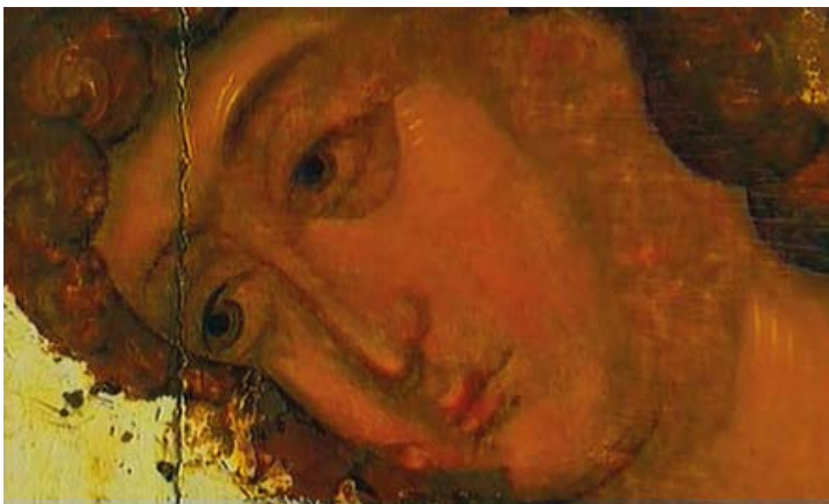
Икона «Троица». Святой преподобный Андрей Рублев. 1411 год. Фрагмент. Троицкий собор. Троице-Сергиева лавра. Икона написана «в похвалу Сергию Радонежскому» по заказу его ученика и преемника игумена Никона. Государственная Третьяковская галерея. Москва.

Дух в человеке проявляется в трех видах: 1. Страх Божий. 2. Совесть. 3. Жажда Бога. Страх Божий — это, конечно, не страх в нашем обычном, человеческом понимании этого слова; это благоговейный трепет перед величием Божиим, неразрывно связанный с неизменною верою в истину бытия Божия, в действительность существования Бога, как нашего Творца, Промыслителя, Спасителя и Мздовоздаятеля. Второе, чем проявляет себя дух в человеке, это — совесть . Совесть указывает человеку, что право, что неправо, что угодно Богу и что не угодно, что должно и чего не должно делать. Совесть есть наш внутренний судия — блюститель закона Божия.