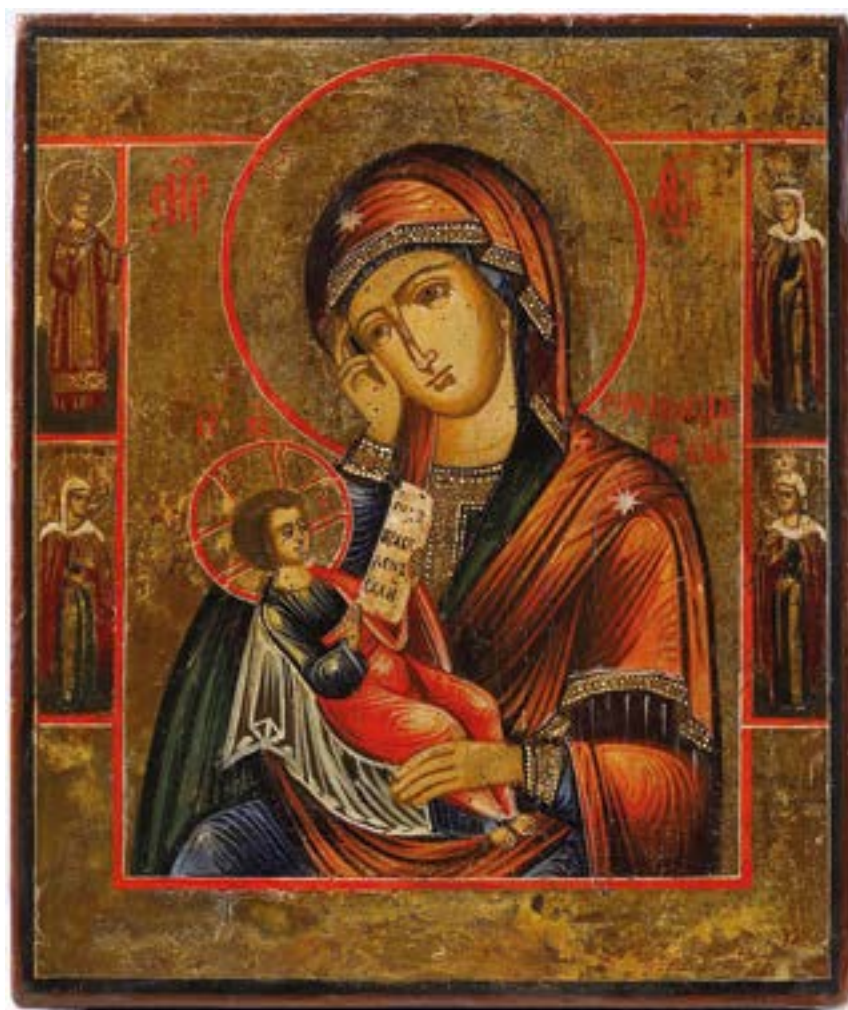
Чудотворная икона Божией Матери «Утоли моя печали». Список.

...Если кто-либо испытывает чье-либо терпение , то это означает, что этот человек постоянно совершает какие-либо действия, которые не нравятся и раздражают другого человека.