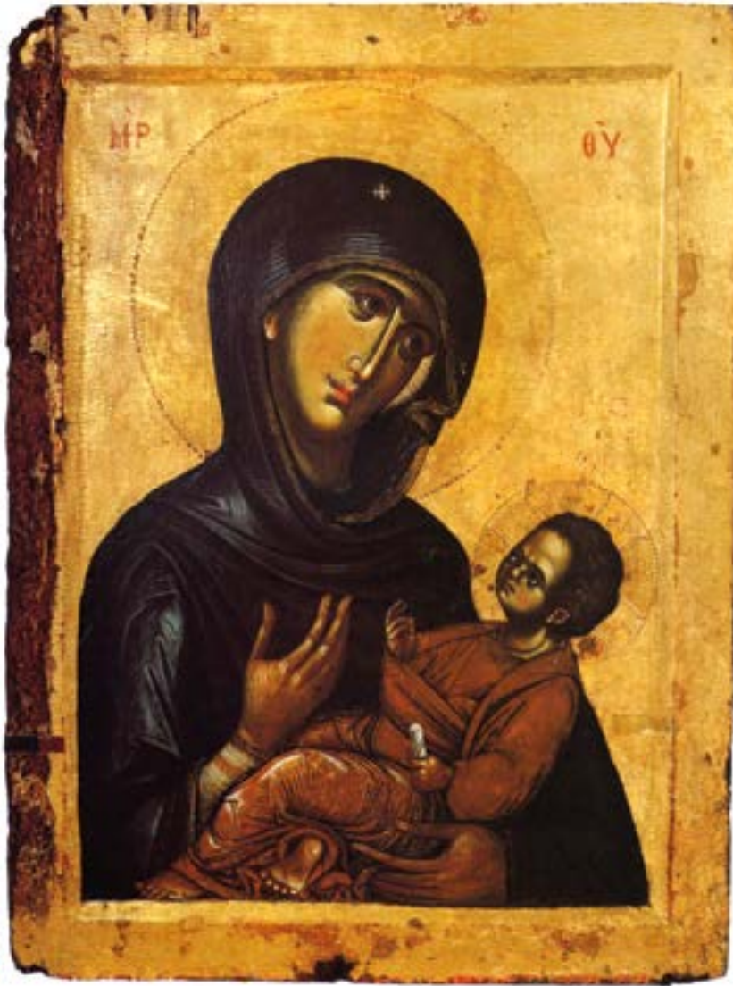
Икона Божией Матери «Аристократуса». Вторая половина XIII века. Монастырь Ватопед. Святая гора Афон.

О, Пресладкий и Всещедрый Иисусе, Спасителю наш, Творче и Владыко! Прими ныне малое сие молебное благодарение и славословие наше, якоже приял еси от волхвов поклонение и дары; и сохрани нас, Твоих рабов, от всякия напасти: и грехов прощение даруй ; и вечныя муки избави верно славящих Твое, от чистыя Девы, Рождество и вопиющих Ти: Аллилуиа.