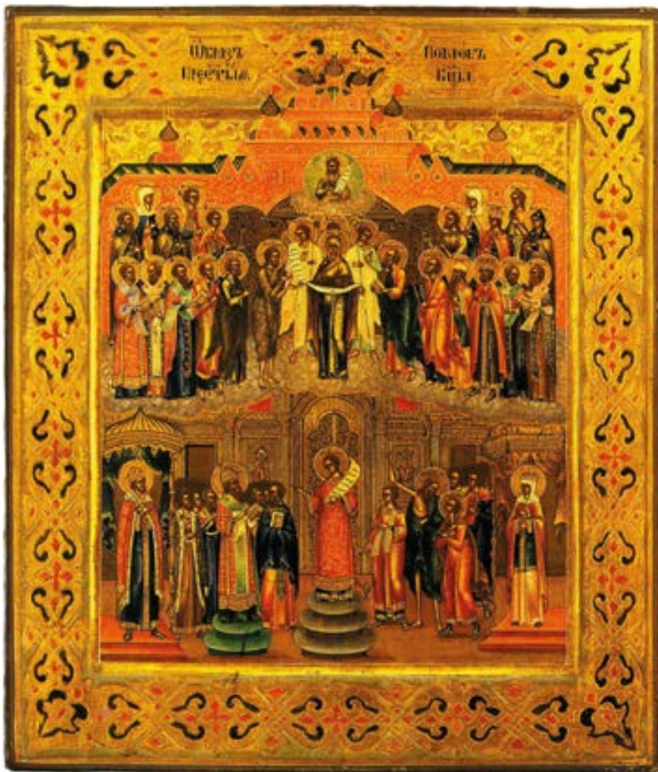
Икона Покрова Пресвятой Богородицы. Середина XIX века. Палех. Государственный музей палехского искусства.