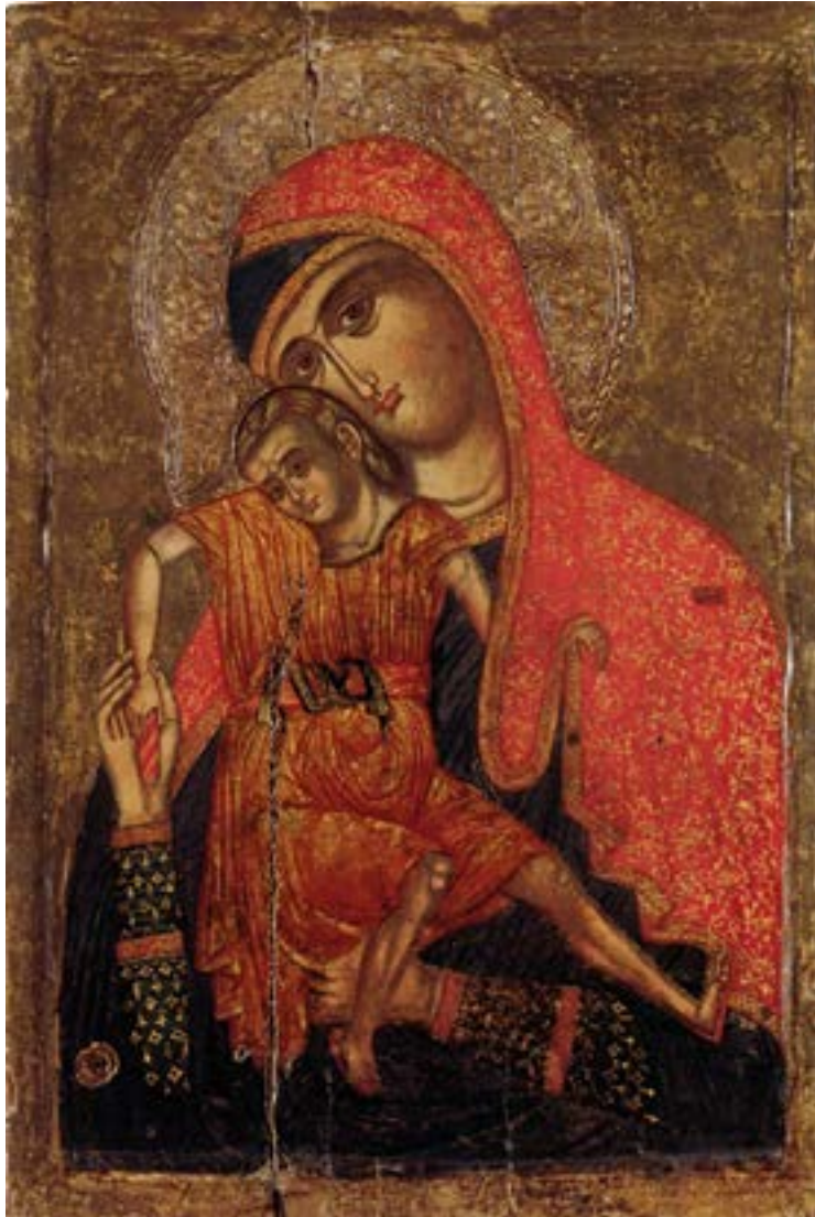
Киккская (Киккотиса) («Милостивая») икона Божией Матери. Конец XIII — первая половина XIV века. Музей при монастыре св. Иоанна Лампадиста. Селение Калопанайотис. Кипр. Греция.

Слы́шит и Твоя ны́не моле́ния Господь Иису́с, избра́нная пала́то Духа Свята́го. Те́мже и мы́, грешни́и, на Твоя́ наде́ющесея покров, Тебе́, я́ко Бо́жией Ма́тери, глаго́лати дерза́ем: Ра́дуйся, от Со́лнца мы́сленнаго озаре́нная и на́с све́том незаходи́мым просвеща́юща ; ра́дуйся, сия́нием пречи́стия ду́ши Твоея́ всю́ зе́млю просвети́вшая. Ра́дуйся, Ра́досте на́ша, покры́й на́с от всяка́го зла́ честны́м Твои́м омофо́ром.