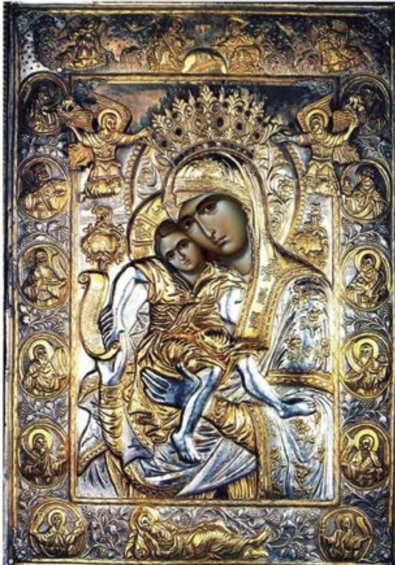
Чудотворная икона Божией Матери «Достойно есть» («Милующая»). 982 год. Успенский собор. Каряя. Святая гора Афон. Греция.

Сильный в крепости, Бог мира, и Отец щедрот, прииде на землю, спасти мир погибающий: Ныне в Вифлеэме яко младенец раждается от Девы: Юже Матерь и Ходатаицу спасения показа , всем Того воплощение славящим и поющим : Аллилуиа.