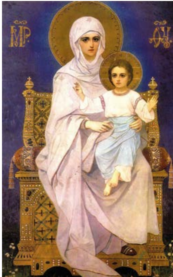
Богородица с младенцем. Виктор Михайлович Васнецов. 1893–1895 годы. Фрагмент иконостаса. Трапезная церковь. Киево-Печерская лавра. Киев. Украина.

Избрáвый от всёх родов пречистейшую А́нгел Дéву, и от Нея́ родивыйся плотию Христé Бóже наш; благодарственная принóсим Тí рабí Твои́ Влады́ко. Ты́ же я́ко имéяй милосéрдие неизречéнное, от всяких на́с бéd свободи́ , зовущих: Иисусе, Сы́не Бóжий, воплотивыйся на́с ра́ди, сла́ва Тебе́.