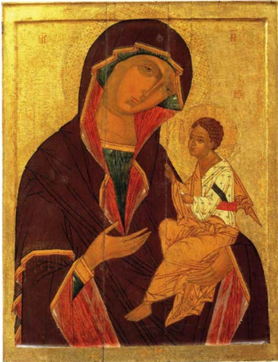
Чудотворная Грузинская икона Божией Матери «Одигитрия» (Путеводительница). Первая половина XVI века. Новгород. Государственный Русский музей. Санкт-Петербург.

«Величайшим сокровищем на земле для людей является родительское благословение. Помню, у одной матери было четверо детей. Никто из них не женился и не вышел замуж. Мать плакала: «Умру от горя, никто из моих детей не женился. Помолись за них». Она была вдовой, ее дети сиротами. Молился я, молился, но безрезультатно. «Что-то здесь не то» — подумал я. Ее дети мне говорят: «На нас навели порчу». — «Да нет, — говорю, — это не от порчи, видно... А, может быть, ваша мать прокляла вас?» — «Верно, отче, — отвечают, — в детстве мы очень шалили, и она постоянно твердила нам: «Да чтоб вам обрубками быть!»»