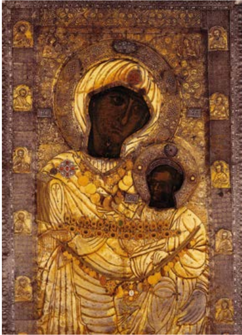
Чудотворная Иверская икона Божией Матери («Вратарница», «Привратница»). Первая половина XI века. Иверский монастырь. Святая гора Афон. Греция.