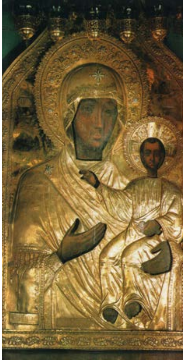
Чудотворная Смоленская икона Божией Матери «Одигитрия» (Путеводительница), «Надвратная». В России с XI века. По преданию, икона написана апостолом и евангелистом Лукой с лика Пресвятой Богородицы. Успенский собор. Смоленск.

более, нежели прочим наследством: ибо через него, по вере, можете получить благословение Отца, «от Которого именуется всякое отечество на небесах и на земле» (Еф. 3:15). «Делом и словом почитай отца твоего и мать, чтобы пришло на тебя благословение от них, ибо благословение отца утверждает дома детей» (Сир. 3:8,9). Поскольку во всяком неложном благословении через благословляющего человека сокровенно течет благотворное Слово Божие, то помыслим, братия, какую мы имеем духовную выгоду, когда благословляем.