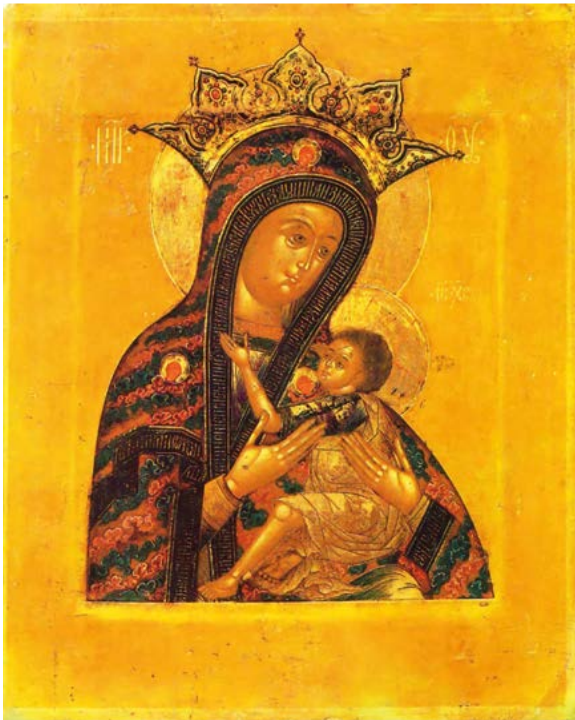
Арапетская (Аравийская) икона Божией Матери («О, Всепетая Мати»). Список второй трети XIX века. Появление иконы связывают с проповедью апостола Фомы в Индии (I век). Государственный научно-исследовательский институт реставрации. Москва.

О, Всепетая Мати, рождающая всех святых Святэйшее Слово! Нынешнее приёмышь приношение, от всякия избави напасти всех, и будущия изми муки, о Тебе вопиющих: Аллилуиа.