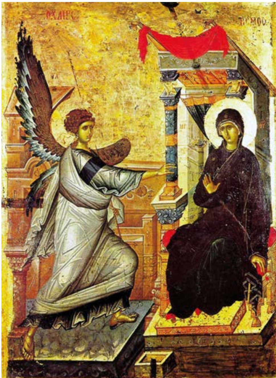
Икона Благовещения Пресвятой Богородицы. 1312–1325 годы. Византия. Оборот иконы — Богоматерь «Душеспасительница» (Психосострия). Церковь Святого Климента. Охрид. Македония.

Ангельских сил Архистратиг послан бысть от Бога Вседержителя к Чистой и Деве благовестити странное и неизреченное чудо: зане Бог, яко Человек, из Нея младодействуется без семени, назидаей весь человеческий род, Людие, благовестите обновление мира!