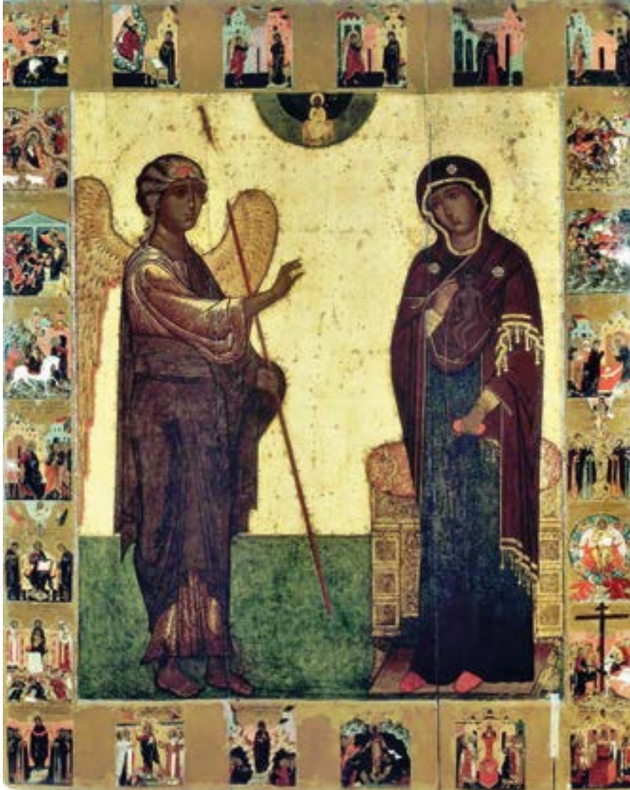
Икона Благовещения Пресвятой Богородицы с клеймами Акафиста на полях. XVII век. Благовещенский собор. Московский Кремль.

Богородица: Являешися Мнѣ истины вещатель, — рече Дѣва, — радости бо общия пришѣл еси благовѣстник. Душу убо очистиx с тѣлом, и по глаголу твоему буди Мнѣ, да вселится Бѣг в Мя, к Немуже вопию с тобою: благословіте, вся дела Господня, Господа и превозносите Его во вѣки.