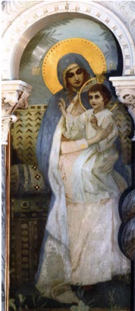
Богородица с младенцем. Михаил Васильевич Нестеров. 1890-е годы. Роспись иконостаса северного придела на хорах. Владимирский кафедральный собор. Киев. Украина.

Рождество́ Твое́, Христе́ Бо́же наш, возсия́ миру свет ра́зума, в нем бо звездам служа́щий, звздою уча́хуся, Тебе кла́няются Со́лнцу Пра́вды, и Тебе́ ве́дети с высоты́ восто́ка: // Го́споди, сла́ва Тебе́!