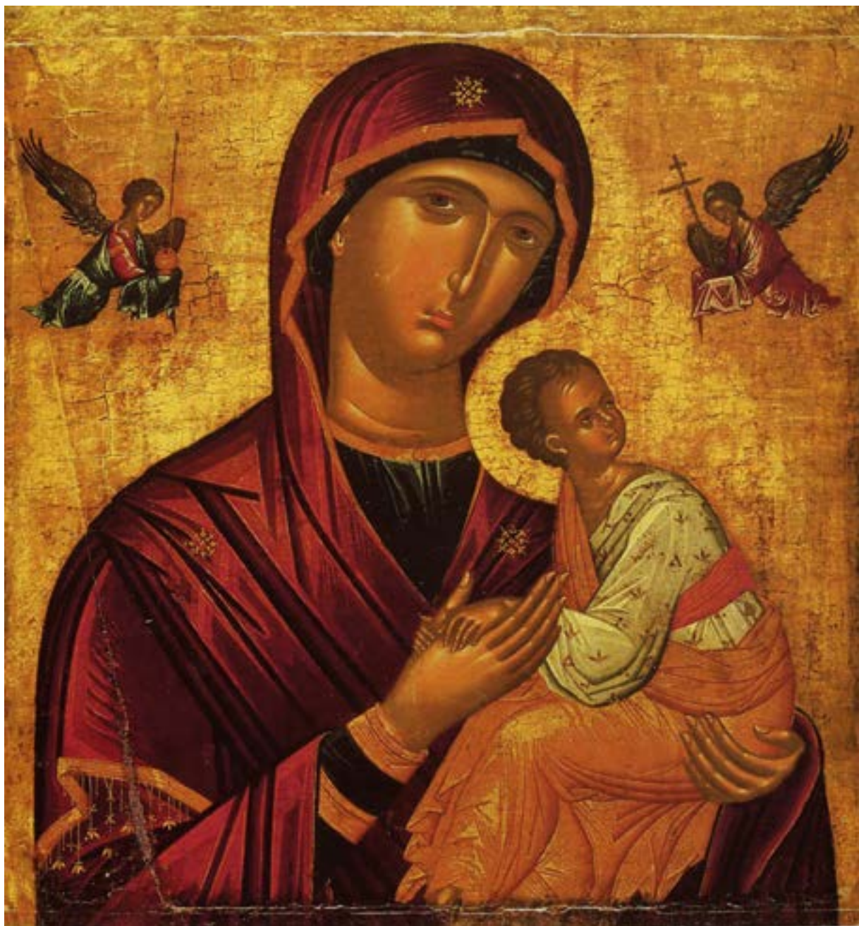
Икона Божией Матери «Страстная». Рицос Андреас. Конец XV века. Крит. Греция. Государственный музей изобразительных искусств им. А. С. Пушкина. Москва.

Самый первый и запоминающийся пример в жизни — это безусловная, жертвенная любовь матери к ребенку.