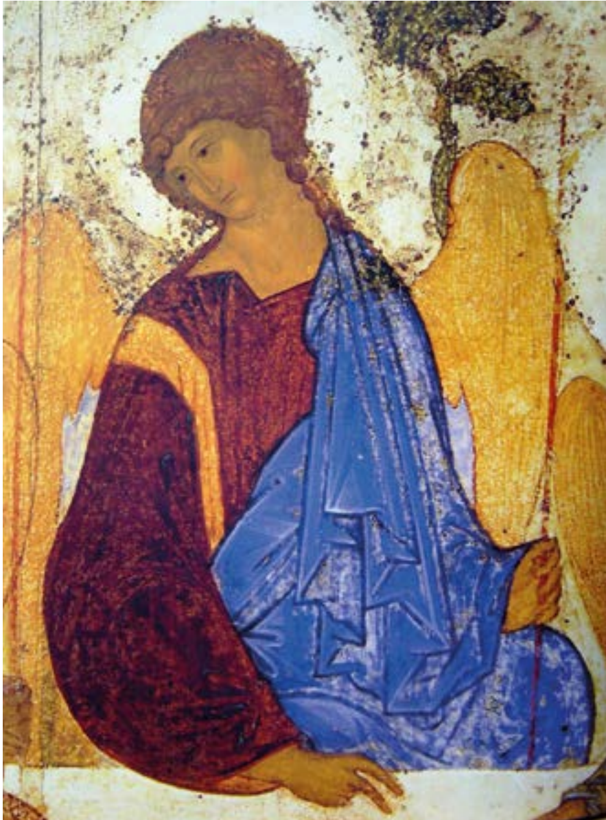
Икона «Троица». Святой преподобный Андрей Рублев. 1411 год. Фрагмент. Троицкий собор. Троице-Сергиева лавра. Икона написана «в похвалу Сергию Радонежскому» по заказу его ученика и преемника игумена Никона. Государственная Третьяковская галерея. Москва.

Смирение — добродетель, противоположная гордыне, и одна из самых главных добродетелей в христианской жизни. В духовной жизни христианина проявляется в том, что человек в любых обстоятельствах пребывает в мире с самим собой и Богом, не возвышает себя над кем бы то ни было, имеет в своем сердце убеждение, что все духовные заслуги дарует ему только Бог, а также пребывает в любви по отношению к ближним.