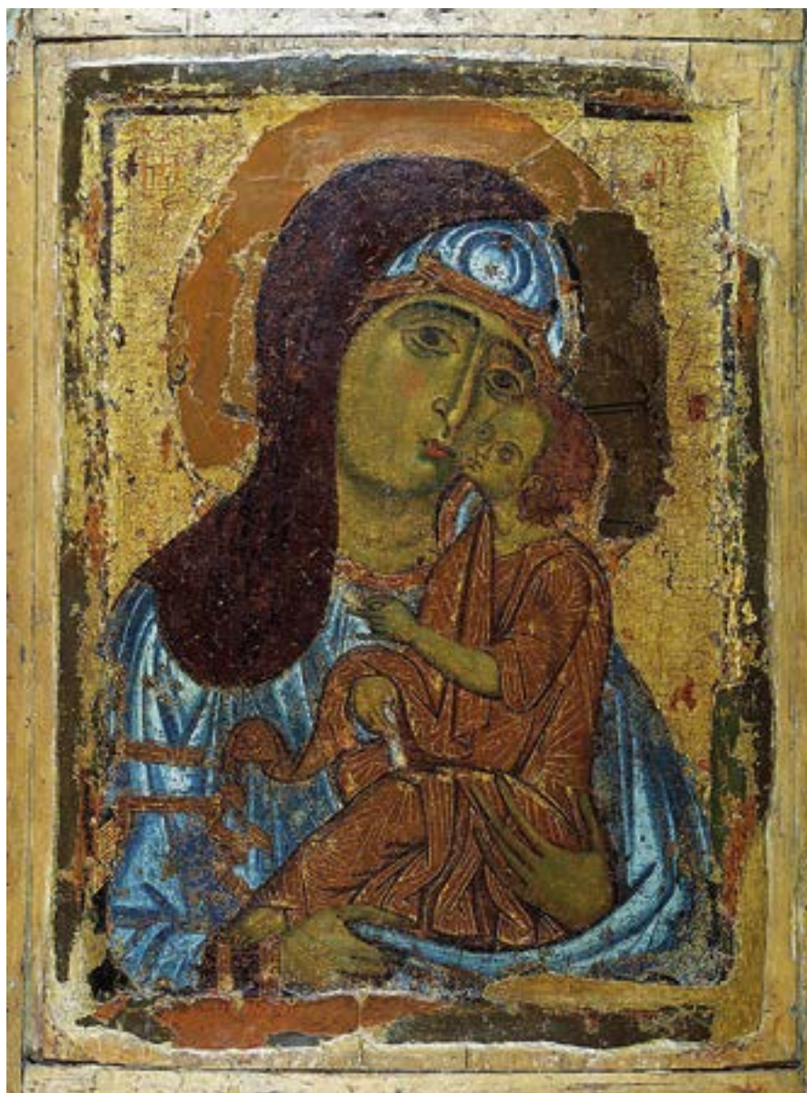
Чудотворная икона Пресвятой Богородицы «Умиление». Последняя треть XII века. Великий Новгород. Успенский собор. Московский Кремль.

Всякое разумѣние и всякъ умъ ангельскій и человѣческій не постигаёт Твоего непостижнаго Рождества Таинства разумѣти ; обаче, Владыко Благій, нашу любовь и веру прими ; и спаси нас, Тебѣ поющих : Аллилуиа.