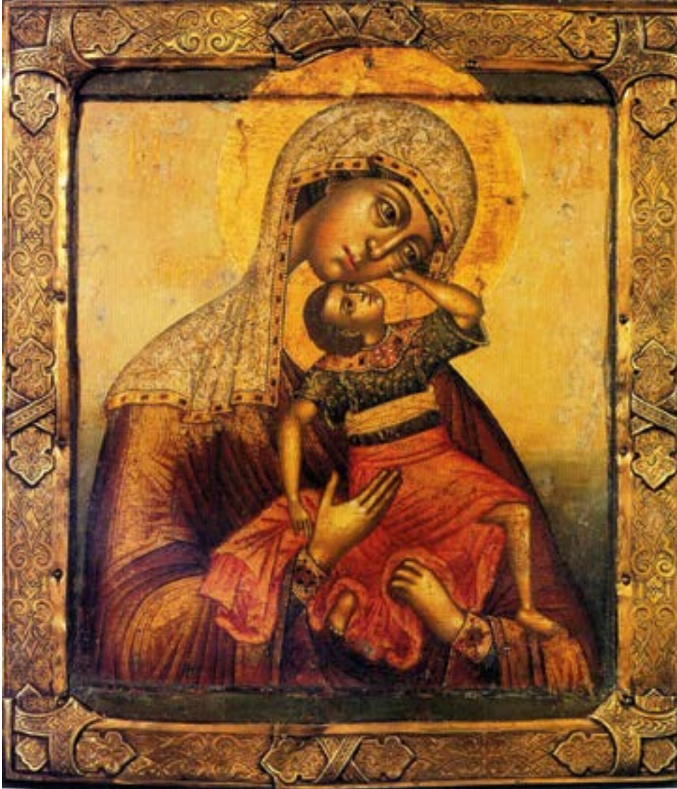
Икона Божией Матери «Взыгание младенца». XVII век. Москва.

Материнство — социально-психологическое и биологическое состояние женщины-матери, возникающее под влиянием ее биологических и социальных отношений с ребенком. Это глубоко эмоциональное состояние.