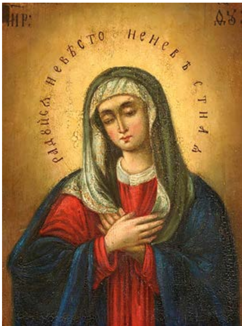
Чудотворная икона Божией Матери «Умиление». (Серафимо-Дивеевская, «Серафимово Умиление», «Всех радостей Радость») Свято-Троицкий Серафимо-Дивеевский женский монастырь. Саров. Новгородская область.

да вознесет вас в свое время» (1 Петр. 5:6). С точки зрения христианства наличие в сердце смирения у человека ведет к глубокому и прочному душевному миру, любви к Богу и людям, состраданию ко всем. Смирение — это трезвое видение самого себя. Смирение — стремление подчинить свою волю святой Божьей воле, воле благой и всесовершенной. Поскольку источником любой добродетели является Бог, то вместе со смирением Он Сам вселяется в душу христианина. Смирение же лишь тогда воцарится в душе, когда в ней «изобразится Христос» (Гал. 4:19). Кроме того, смирение характеризуется принятием жизненных невзгод и бытовых проблем без печали в сердце, со словами: «Боже, да будет воля Твоя на все».