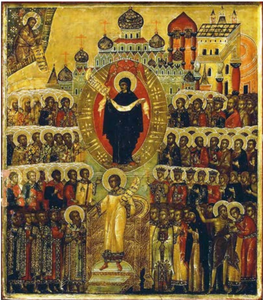
Икона Покрова Пресвятой Богородицы. Начало XVII века. Государственный Русский музей. Санкт-Петербург

О, Пресвятая́ Де́во, Ма́ти Го́спода вы́шних си́л, небесе́ и земли́ Цари́це, гра́да и страны́ нашея́ всемо́щная Засту́пнице! Прими́ хвале́бно-благодаре́тельное пе́ние си́е от на́с, недосто́йных ра́б Твои́х, и вознеси́ моли́твы на́ши ко престо́лу Бо́га, Сы́на Твоего́, да милостив бу́дет неправда́м на́шим и проба́вит благода́ть Свою́ чту́щим всечестно́е и́мя Твое́ и с ве́рою и любо́вию покланя́ющимся чудотво́рному о́бразу Твоему́.