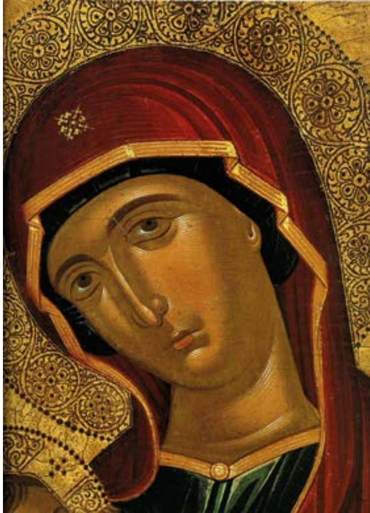
Чудотворная икона Божией Матери «Млекопитательница». XV век. Фрагмент. Святая гора Афон. Греция.

В «Молении Даниила Заточника» говорилось, что «сердце умного укрепляется в теле его красотой и мудростью». В знаменитых древнерусских иконах религиозное их значение сливалось с эстетическим. Эти иконы, по замечательному определению Е. Н. Трубецкого, представляли собой «умозрение в красках»... Симеон Полоцкий включал и «красоту плоти», и «красоту любви в душе» в духовное совершенство человека.