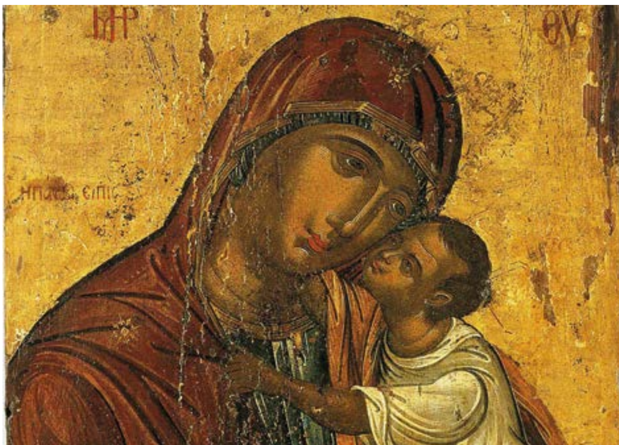
Чудотворная икона Пресвятой Богородицы «Богоматерь Всех Надежда». XVI век. Фрагмент. Крит. Греция.

«Всякое раздражение и ярость, и гнев, и крик, и злоречие со всякою злобою да будут удалены от вас; но будьте друг ко другу добры, сострадательны, прощайте друг друга, как и Бог во Христе простил вас» (Еф. 4:31,32). «И когда стоите на молитве, прощайте, если что имеете на кого, дабы и Отец ваш Небесный простил вам согрешения ваши. Если же не прощаете, то и Отец ваш Небесный не простит вам согрешений ваших» (Мк.11:25,26). «А Я говорю вам: любите врагов ваших, благословляйте проклинающих вас, благотворите ненавидящим вас и молитесь за обижающих вас и гонящих вас, да будете сынами Отца вашего Небесного, ибо Он повелевает солнцу Своему восходить над злыми и добрыми и посылает дождь на праведных и неправедных» (Мф.5:44,45). «Тогда Петр приступил к Нему и сказал: Господи! сколько раз прощать брату моему, согрешающему против меня? до семи ли раз? Иисус говорит ему: не говорю тебе: до семи, но до седмижды семидесяти раз» (Мф.18:21,22).