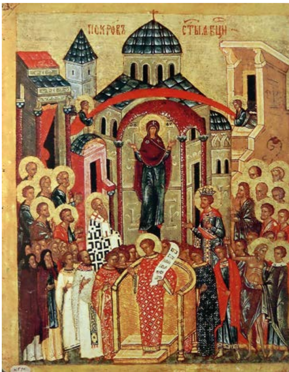
Икона Покрова Пресвятой Богородицы. Конец XV — начало XVI века. Собор Святой Софии. Великий Новгород. Двусторонняя икона-таблетка. На обороте — святые Николай Чудотворец, Иоанн Милостивый, Василий Исповедник. Новгородский государственный историко-архитектурный и художественный музей-заповедник.

Покров Пресвятой Богородицы. Праздник Покрова Пресвятой Богородицы (отмечается 14 октября) пришел на Русь из Византии и стал одним из самых почитаемых. Этот праздник не входит в число двенадцатых, но, несмотря на это, является одним из самых значимых. 14 октября православные христиане вспоминают события середины X века, когда святому Андрею юродивому и его ученику Епифанию было видение Покрова Божией Матери. Это случилось в Константинополе при императоре Льве Премудром. Это были трудные времена для Византии. Империи угрожали нападением сарацины, которые исповедовали ислам. Не видя ниоткуда помощи, в те дни греки во множестве стекались во Влахернский храм, в котором хранились риза Богоматери и Ее головной покров, и молились.