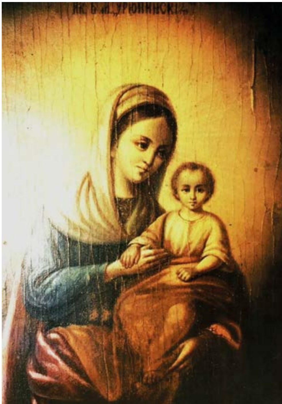
Урюпинская икона Божией Матери. Дата обретения — 1827 год. Храм Покрова Пресвятой Богородицы. Урюпинск. Волгоградская область.

Избранней от всех родов Божией Матери и Царице, явившейся на древе в Донской землѣ, и славу Свою на святых горах показавшую, больные исцеляти, заблудшия обращати. Тѣмже умильно молимся Тебѣ: избави град наш от всякаго зла, да с любовью поем Тебѣ: Радуйся, похвало Урюпинская, града нашего державо и украшение!