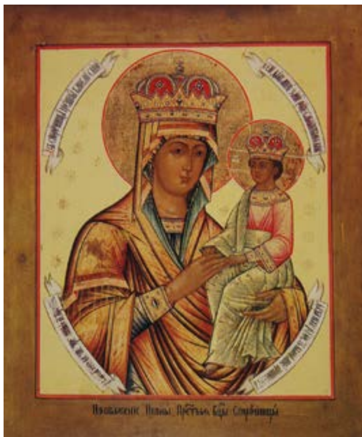
Икона Божией Матери «Споручница грешных». Списание.

Поэтому милосердные стремятся не судить ближнего, а помочь ему и спасти его. Истинно милосердные — это те люди, которые проявляют сострадание, сочувствие к бедным, страдающим и угнетенным людям. В сострадающей душе присутствует мир и покой.