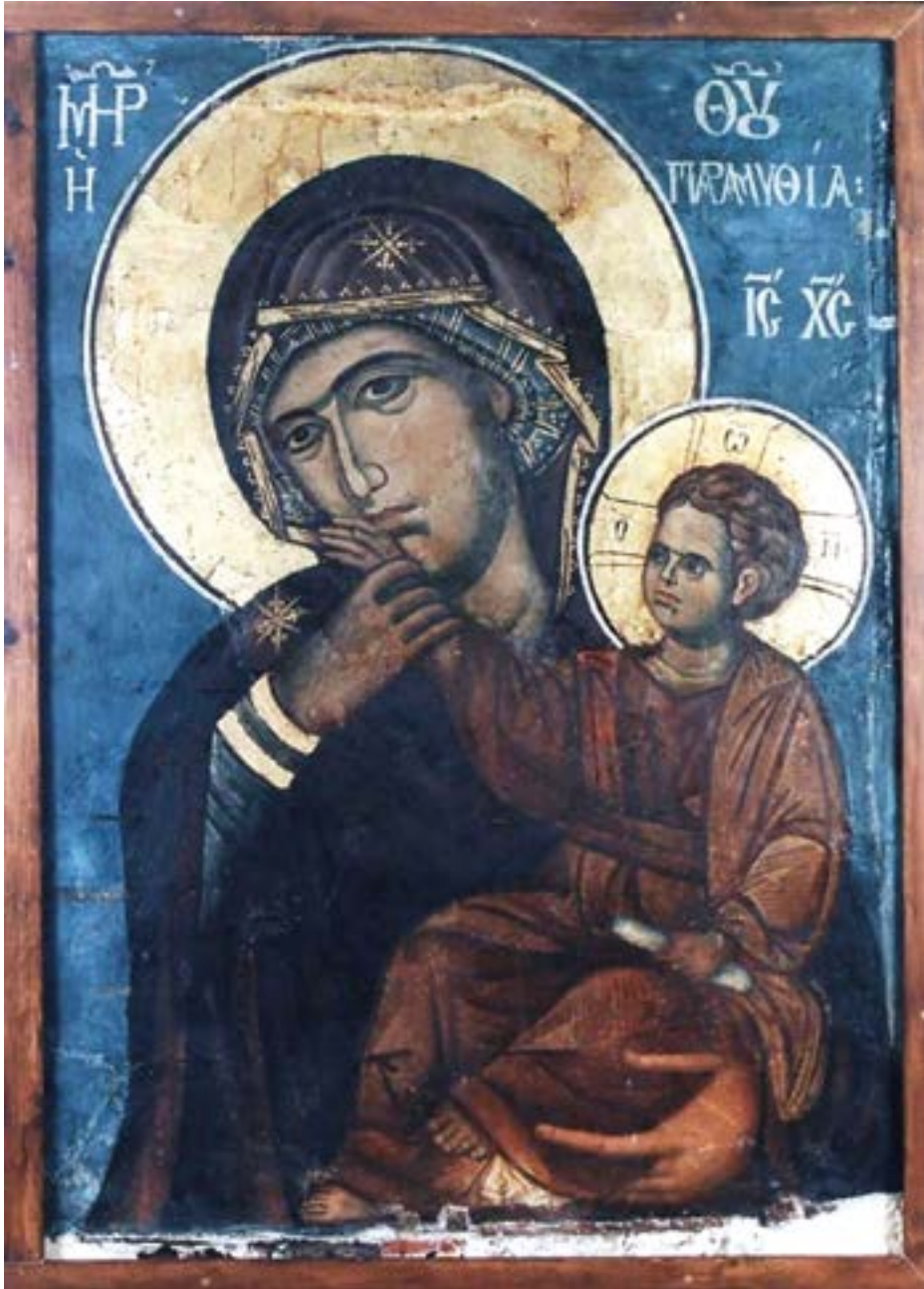
Чудотворная фреска Пресвятой Богородицы «Отрада» (Парамифия), («Увещание», Ватопедская, «Отрада и утешение») XIV век. Нерукотворный образ. Монастырь Ватопед. Святая гора Афон. Греция.

Забота есть труд души и тела, направленный на кого-то другого. Заботиться можно о ком угодно и о чем угодно: о младших и о старших детях, о престарелых людях, о друзьях, о семье, а также о животных, о птицах, об урожае, о порядке и т. д. В детских сообществах есть девиз: «Труд — забота, а не просто работа». Забота наполняет труд смыслами, придает ему направленность, эмоционально окрашивает. Любой тяжкий или неприятный труд, если он — забота, делается легким и приятным.