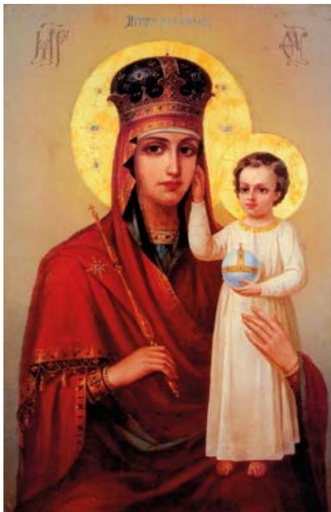
Чудотворная икона Божией Матери «Призри на смирение». Явление образа — 1420 год. Псков.

Смирение по отношению к другим людям — отсутствие гнева и раздражения даже на тех, кто, казалось бы, вполне заслуживает этого. Эта искренняя незлобивость основана на том, что Господь любит каждого человека, с которым произошло разногласие, так же, как и тебя. Потому как любой человек вне зависимости от вероисповедания является образом Божиим. Однако смирение вовсе не предполагает потворство злу и безропотное созерцание, когда твой ближний испытывает страдание от злого умысла другого человека. В данной ситуации предотвращение насилия по отношению к ближнему не идет наперекор понятию «смирения». Смирение — это мир с Богом в любых, самых крайних обстоятельствах, смиренный человек — это тот, кто всегда побеждает зло, но только добром, по слову апостола Павла: «Побеждайте зло добром». Поэтому, когда мы защищаем ближнего, то есть творим добро, мы побеждаем зло — добром.