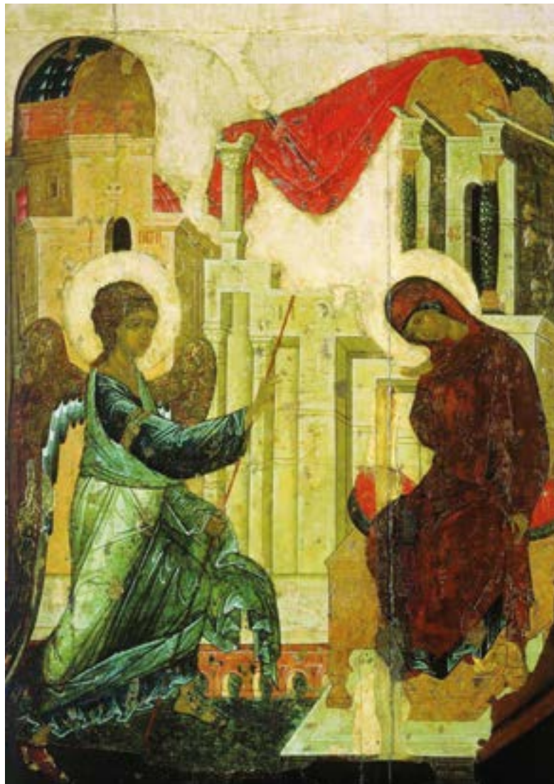
Икона Благовещения Пресвятой Богородицы. Святой преподобный Андрей Рублев, Даниил Черный и мастерская. 1408 год. Успенский собор. Владимир. Государственная Третьяковская галерея. Москва.