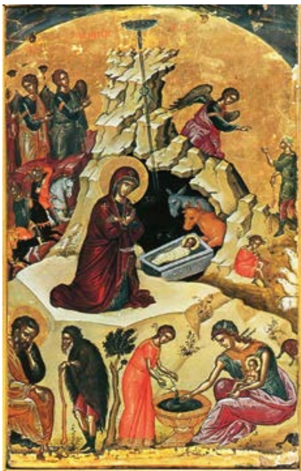
Икона Рождества Христова. Святая гора Афон. Греция.

человеческий! Не бойся, ибо Ты обрела благодать у Бога... Пресвятая Дева приложила исполинский труд для возвышения Своей души к Богу, и на этом пути возвышения встретила Ее благодать Божия. Умилив Девическую душу Марии, крылатый вестник Божий теперь передает Ей главное послание небес: и вот, зачнешь во чреве, и родишь Сына, и наречешь Ему имя: Иисус. Он будет велик и наречется Сыном Всевышнего, и даст Ему Господь Бог престол Давида, отца Его; и будет царствовать над домом Иакова вовеки, и Царству Его не будет конца. Божий вестник глаголет точно до подробностей. Зачнешь во чреве, то есть в теле; как и Псалмопевец употребляет схожее выражение: и дух прав обнови во утробе моей (Пс. 50:12)... Архангел глаголет Деве не все о Господе Иисусе Христе, но лишь то, что Ей как пророчество известно и понятно из Священного Писания. Он не говорит Ей о всемирной и всечеловеческой роли Иисуса, не говорит о Нем как о Спасителе всех народов и племен, как об Основателе духовного Царствия, Судии всех живых и мертвых, а еще менее — как о Слове Божиим, Одной из Трех вечных Ипостасей Святой Троицы. Если бы он сказал Ей это, он еще более смутил бы Ее.