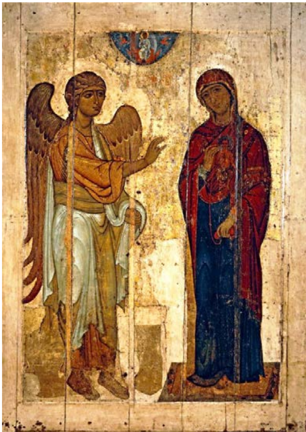
Чудотворная икона Благовещения Пресвятой Богородицы («Благовещение Устюжское»). 1130–1140 годы. Георгиевский собор Юрьева монастыря. Великий Новгород. Государственная Третьяковская галерея. Москва.

Богорóдице Дéво, ра́дуйся, Благода́тная Мари́е, Госпо́дь с Тобо́ю; благослове́нна Ты в жена́х и благослове́н Плод чре́ва Твоего́, я́ко Спа́са родила́ еси́ душ наших.