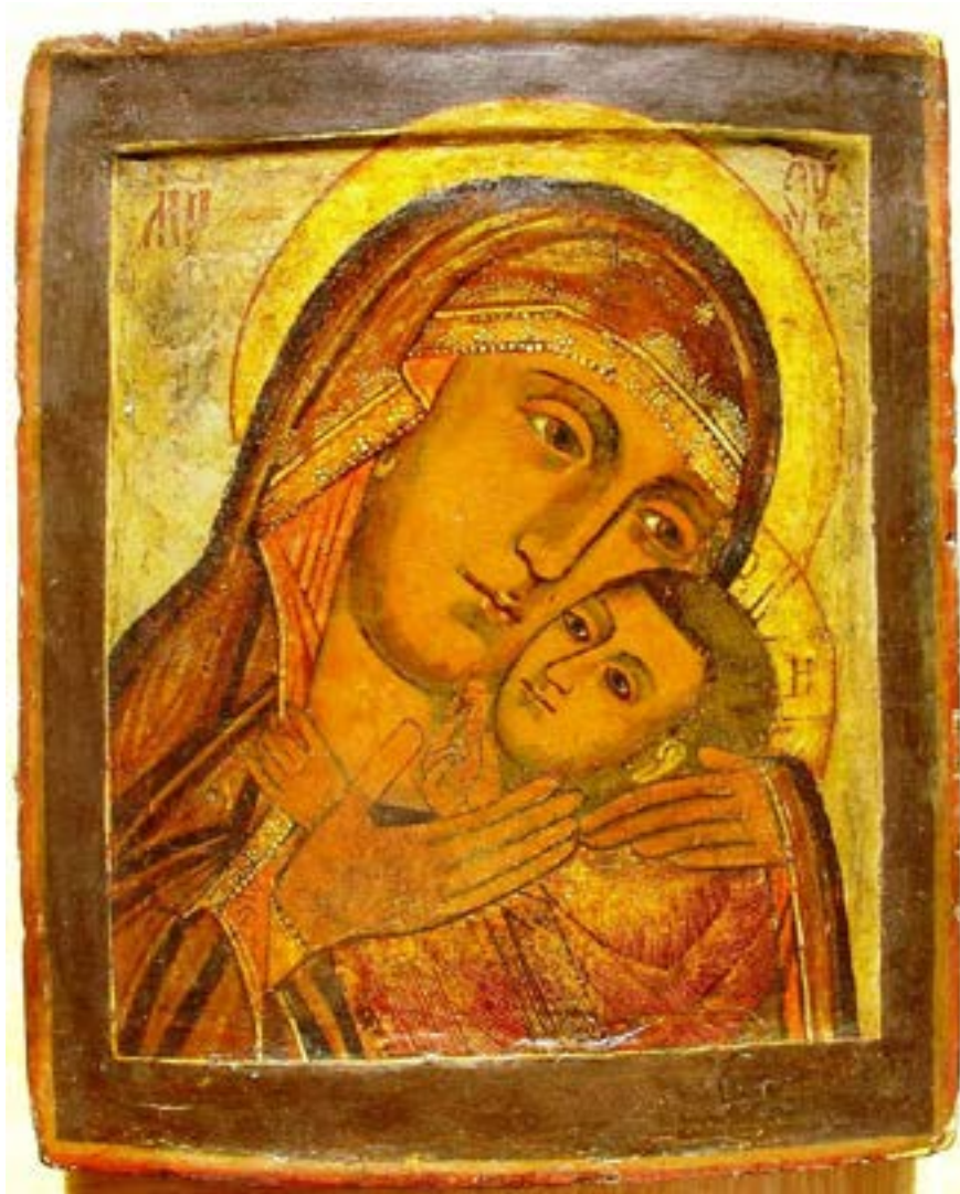
Чудотворная Корсунская («Ефесская») икона Божией Матери. Списание. XVIII век.

Нежность — оттенки поведения (легкое прикосновение руки, улыбка, поцелуй, объятие, мягкий и ласковый взгляд, доброе слово, определенная интонация и т. д.). Нежность присуща только человеку как результат тысячелетнего развития его культуры, как свидетельство его неисчерпаемой способности самосовершенствоваться.