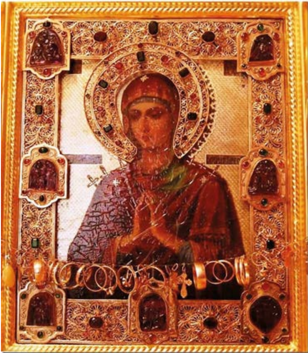
Чудотворная мироточивая икона Божией Матери «Умягчение злых сердец» («Семистрельная»). Село Бачурино. Новомосковский административный округ. Москва.

Новый Завет о жизни Девы Марии говорит очень кратко, лишь несколько эпизодов в нем связаны с именем матери Иисуса: Мф. 1:16,18–25; 2:11,13–15,19–23; 12:46–50; 13:55; Мк. 3:31–35; 6:3; Лк. 1:26–56; 2:1–40,48; Лк. 2:4–7; Лк. 2:16–52; Лк. 8:19–21; Ин. 2:1–12; 19:25–27; Деян. 1:14. (Давыдов И. П. Богородица // Новая Российская энциклопедия: в 12 т. — М. : ООО «Издательство „Энциклопедия“» : ИД «Инфра-М», 2003. — С. 283–284).