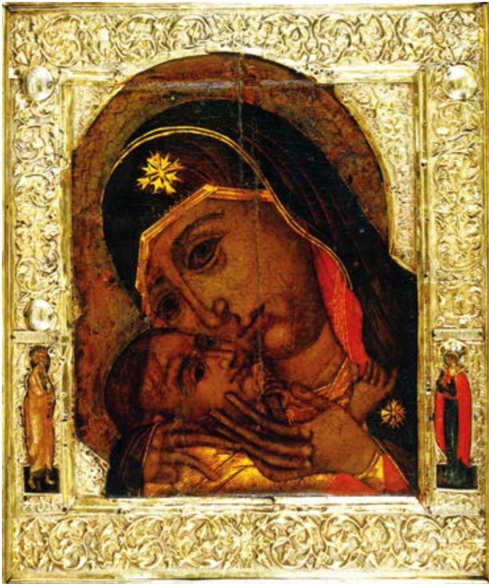
Чудотворная Корсунская икона Божией Матери с апостолом Петром и пророчицей Анной на полях. XVII век.

Святитель Филарет, митрополит Московский. «Слова и речи»: «Кто имеет живую веру, тот имеет Божие благословение» (Святитель Тихон Задонский). Слово «благословение» происходит от «благого слова». Если же хотите узнать, откуда происходит «благое» слово, где его первоисточник и глубочайший корень его силы, то найдете, по указанию божественного тайнозрителя Иоанна, что «в начале было Слово, и Слово было у Бога, и Слово было Бог... В Нем была жизнь, и жизнь была свет человеков» (Ин. 1:1,4).