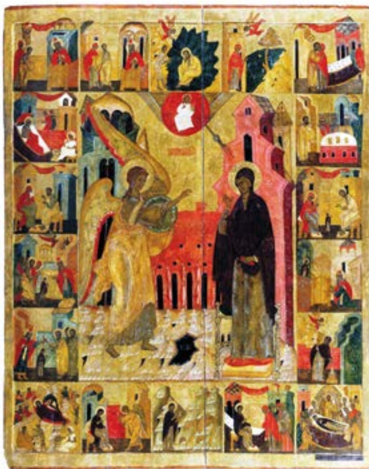
Икона Благовещения Пресвятой Богородицы. XVI век. Сольвычегодский музей-заповедник.

и оттоле началось то, что, если смотреть изнутри, называется рабством сердца человеческого, а если смотреть извне, называется всемирной историей. Не в силах сам держать свое сердце руками своими, человек прислонял его к окружающим существам и вещам. Но к чему бы человек ни прислонил сердце свое, оно от этого пачкалось и повреждалось. О бедное сердце человеческое, собственность многих незаконных владельцев, жемчуг среди свиней! Как ты окаменело от долгого рабства, как ты потемнело от тяжелой тьмы! Сам Бог должен был сойти, дабы освободить тебя от рабства, дабы спасти тебя от тьмы, дабы исцелить тебя от греховной проказы и снова взять в Свои руки. А повесть сего Божия схождения к людям начинается с ангела и Девы, с беседы между небесною чистотою и земною чистотою. Когда нечистое сердце беседует с нечистым сердцем — это война. Когда нечистое сердце беседует с чистым сердцем — и это война. И только когда чистое сердце беседует с чистым сердцем, сие есть Схождение Бога к людям — самое неустрашимое деяние Божией любви, Божия человеколюбия, самая радостная весть для чистых и самое невероятное событие для нечистых сердцем. Как столп огненный в самом густом мраке — таково сошествие Бога к людям.