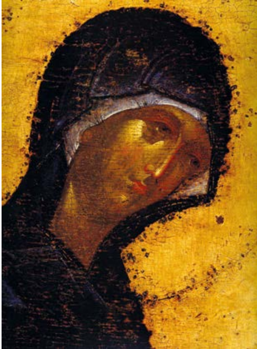
«Деисус». Икона Божией Матери. Феофан Грек. 1405 год. Фрагмент. Благовещенский собор. Московский Кремль.

Бурею многих бед одержимым нам помогаеши , Владычице: стойши бо пред лицом олтаря Господня, воздвигши рuce Твой и молишися , яко да нашу недостойную молитву призрит Господь, Царь славы, и послушает прошения призывающих имя Твое святое, к Сыну же Твоему зовущих: Аллилуиа.