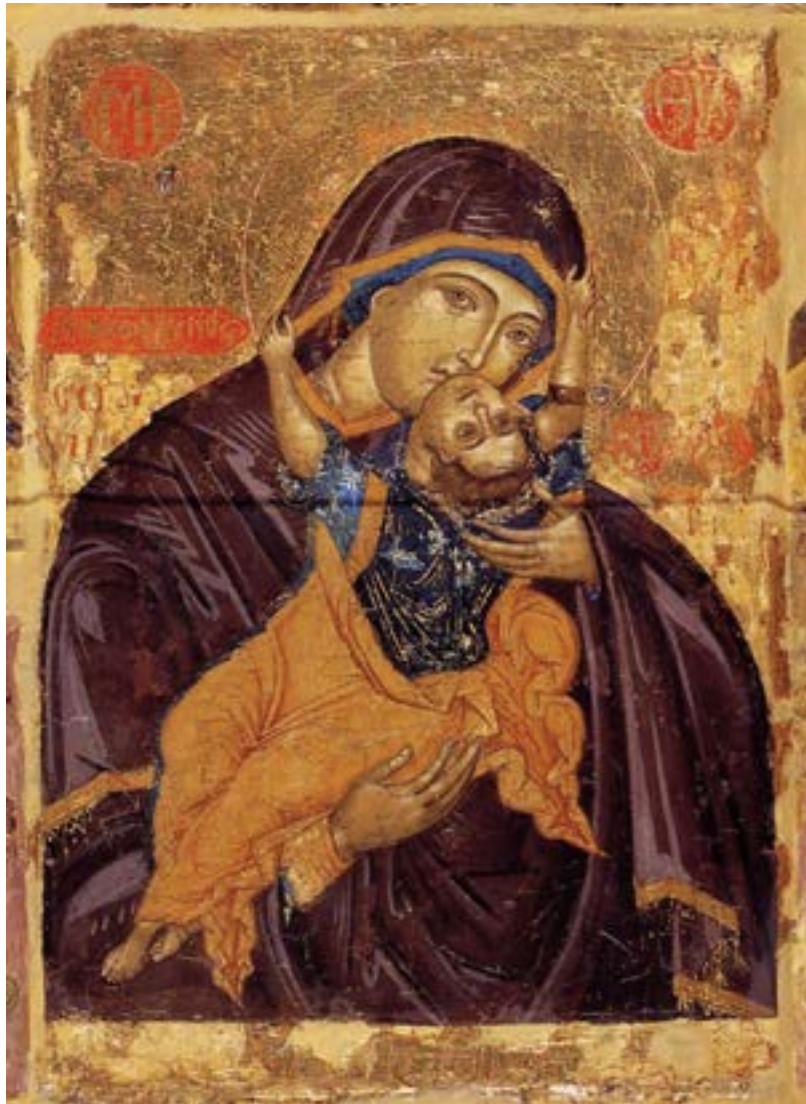
Икона Божией Матери «Сердечная» (Кардиотиса). Ангелос Аконтантос. Первая половина XV века. Византийский и Христианский музей. Крит. Греция.

Сподоби́ убо и нас в де́нь пресла́внаго Рожде́ства Твоего́ чи́стым се́рдцем и отве́рстою душо́ю испове́дати Тя и́стиннаго А́гнца Бо́жия, успа́ждающего и укрепляющего нас наде́ждою грядущих бла́г в неме́ркнущем Све́те Трисия́тельнаго Боже́ства, И́мже вся живе́т и дви́жется , И́мже обнове́ние на́шего первообра́знаго быти́я да усоверши́тся.