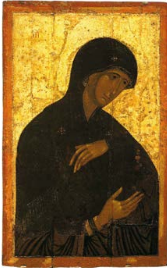
«Деисус». Икона Божией Матери. 1387–1395 годы. Высоцкий монастырь. Серпухов. Государственная Третьяковская галерея. Москва.

«Блаженны милостивые, ибо они помилованы будут» (Мф. 5:7). Милостивыми называют тех людей, которые милосердно и сострадательно относятся ко всем остальным людям. Милостивые люди имеют доброе сердце, и они всегда готовы помочь нуждающимся людям по мере возможности. За это милостивые люди сами будут удостоены у Бога великой милости, они будут помилованы. С позиции христианского учения, быть милостивым — это значит к другим людям относиться лучше, чем они это заслужили. Именно так к людям относится Бог, проявляя Свою великую милость к нечестивым и неблагодарным.