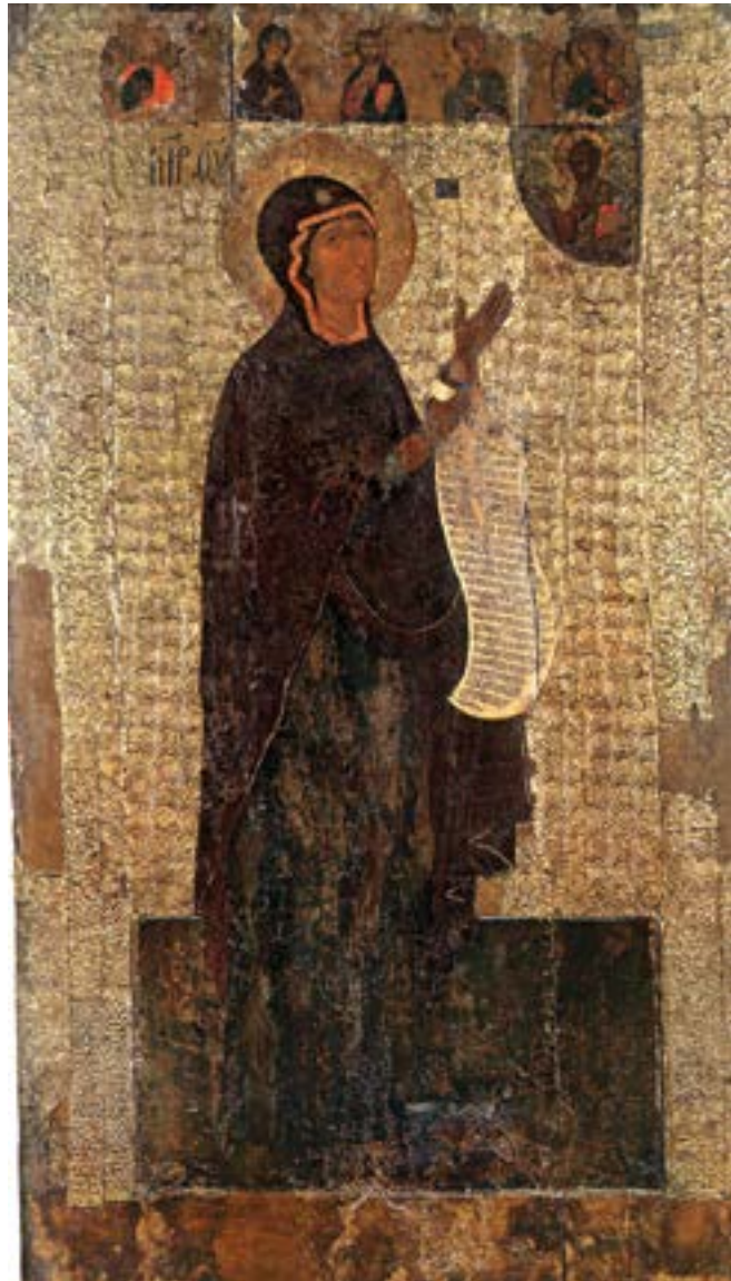
Чудотворная Боголюбская икона Божией Матери (Агиосоритисса). Первообраз . 1155 год. Владими́ро-Суздальский музей-заповедник. Владимир.

Тебе говорю, встань!» И случилось невероятное — мертвый ожил, сел в гробу и стал говорить (Лк. 7:12–16). Потрясенный народ ликовал и славил Бога, а мать и ее оживший сын в тот момент были, наверное, самыми счастливыми людьми на свете. Мать приобщает дитя к жизни. В его уста она вкладывает родной язык, вобравший богатство разума, мысли и чувства народа. Она наполняет его духовной силой, помогает постичь вечные ценности. Многим добрым верующим матерям доводилось переживать о своих детях, погибающих в омуте порочной беспутной жизни. Некоторым приходилось многие годы проводить в скорбях, смиренно ожидая и надеясь. Их святые слезы и молитвы не пропали даром. Наглядный пример из прошлого — жизнь святого Аврелия Августина. Сын язычника и христианки, Августин в детстве и юности был беспутным малым.