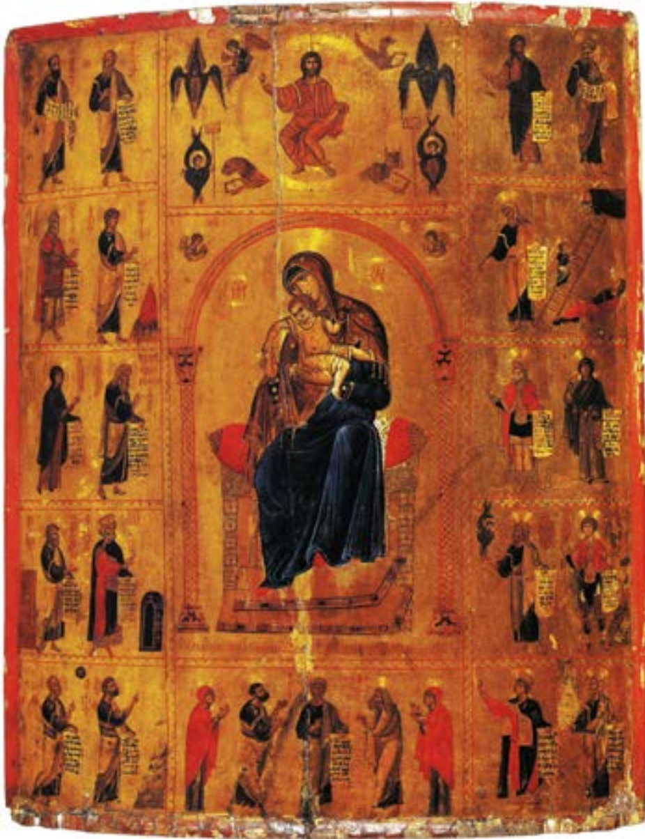
Чудотворная икона Пресвятой Богородицы «Умиление» (Елеуса) с пророками. XI век. Монастырь Святой Екатерины. Синай. Египет.

«Материнская молитва со дна моря достанет» — эта пословица давно уже стала притчей во языцех. Сказана она не ради красного словца. Это истина, актуальная во все времена, подтвержденная бесчисленными примерами удивительной силы и действенности молитв миллионов матерей. Святая материнская любовь способна преодолевать любые преграды, добиваться невозможного и творить настоящие чудеса. Особенную силу имеет слово матери. Нет ничего светлее и бескорыстнее любви матери. С первого дня рождения ребенка мать живет его дыханием, его слезами и улыбками. Мать нужна ребенку. В этом смысл ее жизни.