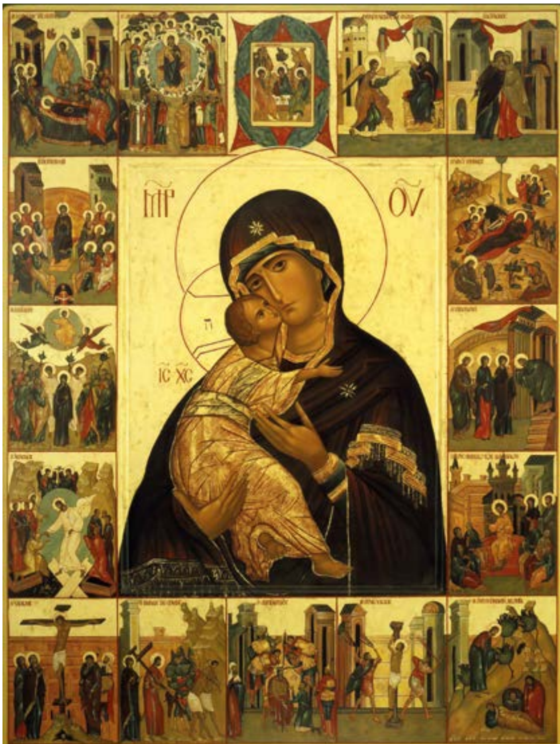
Владимирская икона Божией Матери с клеймами жития на полях. XXI век.

Взбранной Воеводе победительная, яко избавльшися от злых, благодарственная восписуем Ти раби Твои, Богородице; но яко имущая державу непобедимую, от всяких нас бед свободи, да зовем Ти: радуйся, Невесто Невестная!