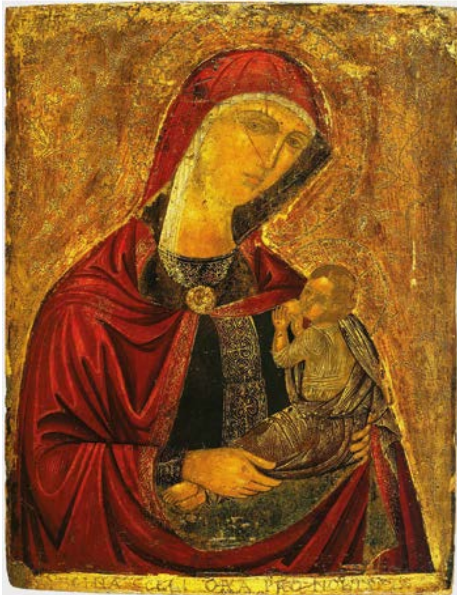
Чудотворная икона Божией Матери «Млекопитательница» (Галактотрофуса). Крит. Греция.

Забота (евр. дэага йагон ), в первую очередь — беспокойное и гнетущее состояние, связанное с обдумыванием предстоящего поступка или события (Пс. 12:3, в Синодальном переводе — «скорбь»; Притч. 12:25, в Синодальном переводе — «тоска»; Иез. 12:18, в Синодальном переводе — «печаль»). Наряду с этим, слово «забота» означает опеку сильного над слабым, над тем, кто доверен сильному или зависим от него. В этом смысле Бог заботится о Своих (Неем. 9:21; Пс. 54:23; 1 Пет. 5:7), как и обо всем сотворенном мире (Мф. 5:45; 6:26,28–30). В этом смысле следует понимать Его призыв не заботиться о пище и одежде (Пс. 126:2; Мф. 6:25–34; Лк. 21:34; ср.: Пс. 39:18). Бог повелевает ученикам не заботиться о правильных ответах правителям, ибо им «будет дано, что сказать» (Мф. 10:19,20; Лк. 12:11).