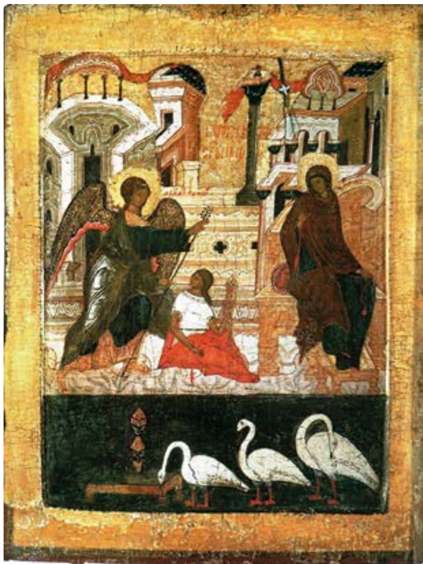
Икона Благовещения Пресвятой Богородицы. XVI век. Покровский монастырь. Суздаль.

Каждое творение — радость для Бога, и сию радость Свою Бог любит разделять с другими... Дева должна послужить вратами, чрез кои Спаситель мира войдет в мир как в Свою мастерскую... Ангел, войдя к Ней, сказал: радуйся, Благодатная! Господь с Тобою; благословенна Ты между женами. Новое творение — радость Богу и людям; потому оно и открывается благовестием: радуйся! Словом сим начинается драма нового творения. Сие есть первое, начальное слово, прозвучавшее, когда стал подыматься занавес великой тайны... И если человек создал пространство между собою и Богом, вот, Бог все-таки первым приближается к человеку, дабы навести мост над пространством тем... Она же, увидев его, смутилась от слов его и размышляла, что бы это было за приветствие.