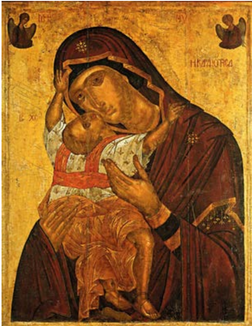
Икона Божией Матери «Сердечная» (Кардиотисса). Ангелос Аконтантос. Первая половина XV века. Греция. Византийский и Христианский музей. Афины. Греция.

Хотя́й долготерпели́вый Всеви́дец Госпо́дь явѣти Своего́ человеколю́бия неизсле́димую щедро́т бе́здну, избра́ Тебе́ еди́ну в Ма́терь Себе́, и сотвори́ Тя лю́дем непреодоле́нное защище́ние: да а́ще кто́ от ни́х и пра́ведным судо́м Бо́жиим осужде́ния досто́ин явѣтся, Твои́м о́баче держа́вным покрово́м сохраня́ется на покая́ние, зовѣ́й: Аллилу́иа.