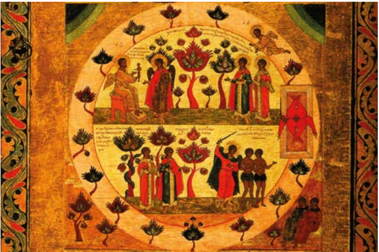
Клеймо северной алтарной двери с трехчастной композицией «Сотворение мира». 1570-е годы. Фрагмент. Благовещенский собор. Сольвычегодск.

Если бы человек и не знал из Священного Писания, что, кроме тела, он имеет еще душу, то при одном уже только внимательном отношении к себе и окружающему миру он мог бы понять, что присущие только ему: разум, сознание, совесть, вера в Бога — все то, что отличает его от животного, составляет его душу. (По проповедям митрополита Крутицкого и Коломенского Николая (Ярушевича)). https://azbyka.ru/otechnik/Joann_Krestjankin/razmyshlenija-o-bessmertnoj-dushe/