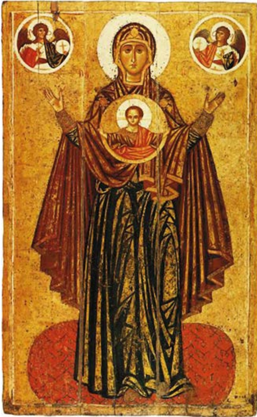
Икона Божией Матери «Великая Панагия (Всесвятая)», «Оранта» (Молящаяся). XII–XIII века.

Слово Божие на землю ныне сниде, ангел предста, вопия Деве: радуйся, Благословенная, Яже печатью едина сохраниши, во утробе приемши Предвечнаго Слова и Господа, да от прелести спасет, яко Бог, род человеческий.