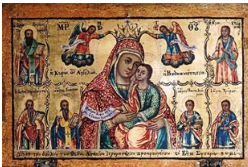
Икона Божией Матери «Вулкану» («Вулканиотисса»). Пелопоннес. Греция.

Душе́вность — внимательность, гуманность, добросердечие, добросердечность, доброта, добролюбие, духовность, душа, задушевность, искренность, неподдельность, непритворность, отзывчивость, родственность, сердечность, сострадательность, сочувственность, участливость, чуткость.