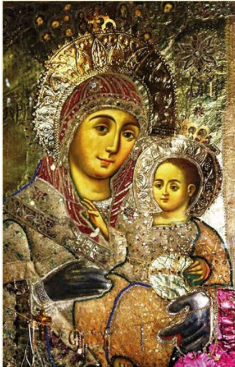
Чудотворная Вифлеемская икона Божией Матери. Храм Рождества Христова. Вифлеем. Израиль.

Любовь — особое состояние человеческой души и человеческое отношение, самопожертвование, забота, дарение. Любовь возникает как самое свободное и постольку «непредсказуемое» выражение глубин личности; ее нельзя принудительно ни вызвать, ни преодолеть. Специфическим содержанием любви является самоотверженность, самоотдача и возникающее на этой основе духовное взаимопроникновение. «Истинная сущность любви состоит в том, чтобы отказаться от сознания самого себя, забыть себя в другом «я» и, однако, в этом же исчезновении и забвении впервые обрести самого себя и обладать самим собою» (Гегель. Соч. — Т. 13. — М., 1940. — С. 107).