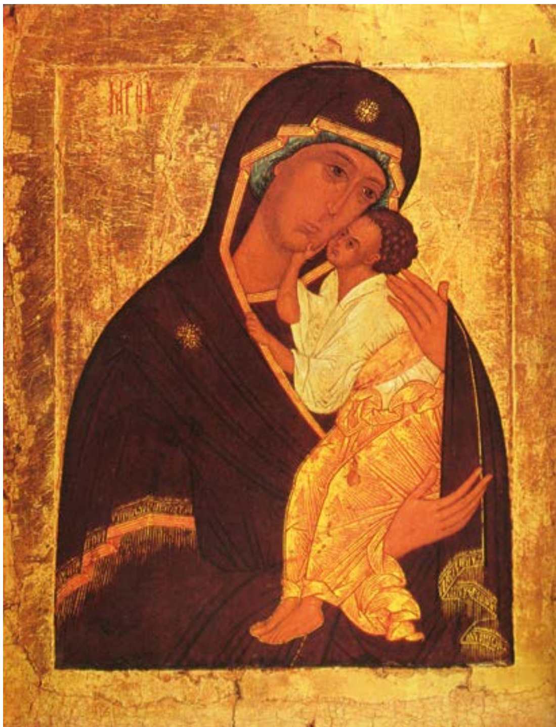
Чудотворная Ярославская икона Божией Матери. Список. XV–XVI века. Государственная Третьяковская галерея. Москва.

Нежность — положительное нравственно-этическое качество личности, проявляющееся как ласка, мягкость в общении, как любовь, признание другого человека. Это может быть нежное, ласковое, мягкое, доброе слово или поступок, приятное и тонкое (не грубое) обращение.