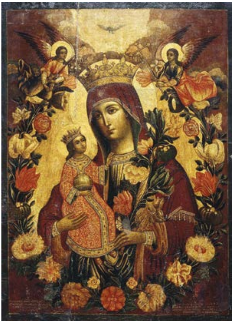
Чудотворная икона Божией Матери «Неувядаемый цвет» («Благоуханный цвет»). XVIII век. Святая гора Афон. Греция. Государственная Третьяковская галерея. Москва.

«Красота души есть соразмерность в добродетели, а безобразие — нарушение меры вследствие порока» (Святитель Василий Великий). Слово «красота» происходит от праславянского «краса». Прилагательное «красный» в праславянском и древнерусском языках имело значение «красивый», «прекрасный», «светлый» (отсюда, например, Красная площадь, красна девица), а не обозначало красный цвет (он назывался словами с корнем -чърв- , как ныне в украинском «червоний»). Слово «красный» стало наименованием для красного цвета лишь во время образования национального великорусского языка, возможно, благодаря эстетическим свойствам красного цвета. Помимо слов «краса», «красота» отношение к красивому и прекрасному в старославянском и древнерусском языках выражалось словами «лепый», «лепота» (и сейчас мы говорим: «великолепный», а в качестве отрицания — «нелепый»).