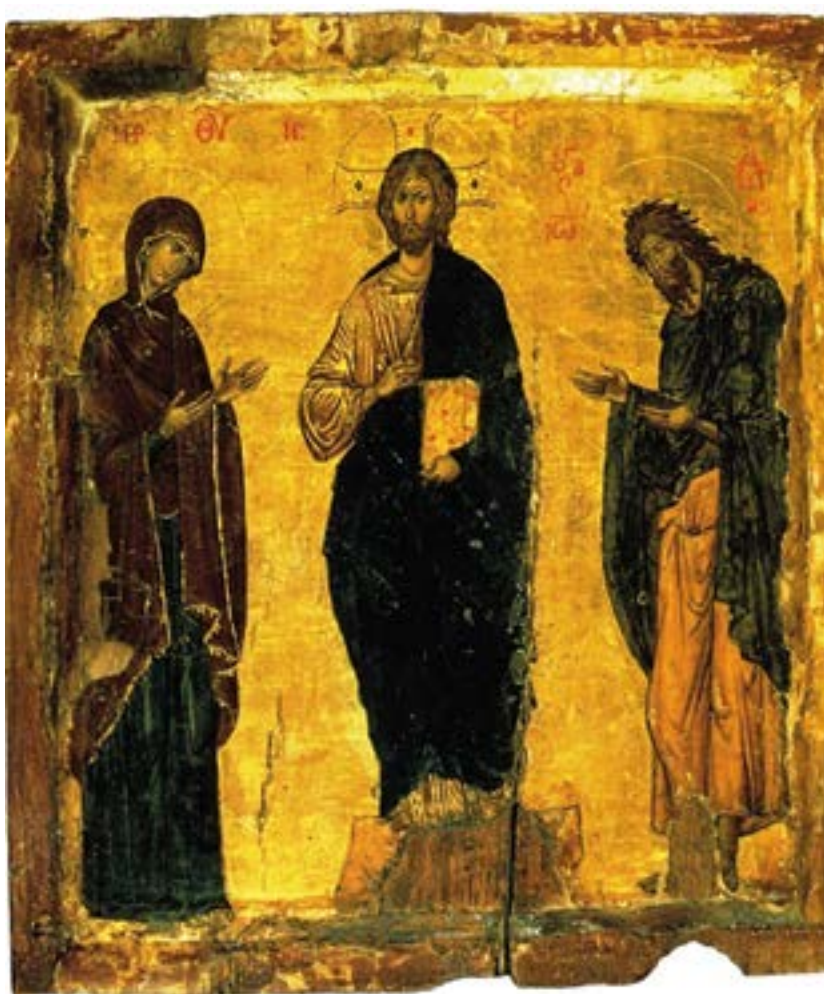
Икона «Деисус» («Деисис» — моление). Византия.

Благодатный — исполненный благодати, всякого блага и счастья; получивший (-ая) великую благодать или милость от Бога; исполненный (-ая) даров Святого Духа.