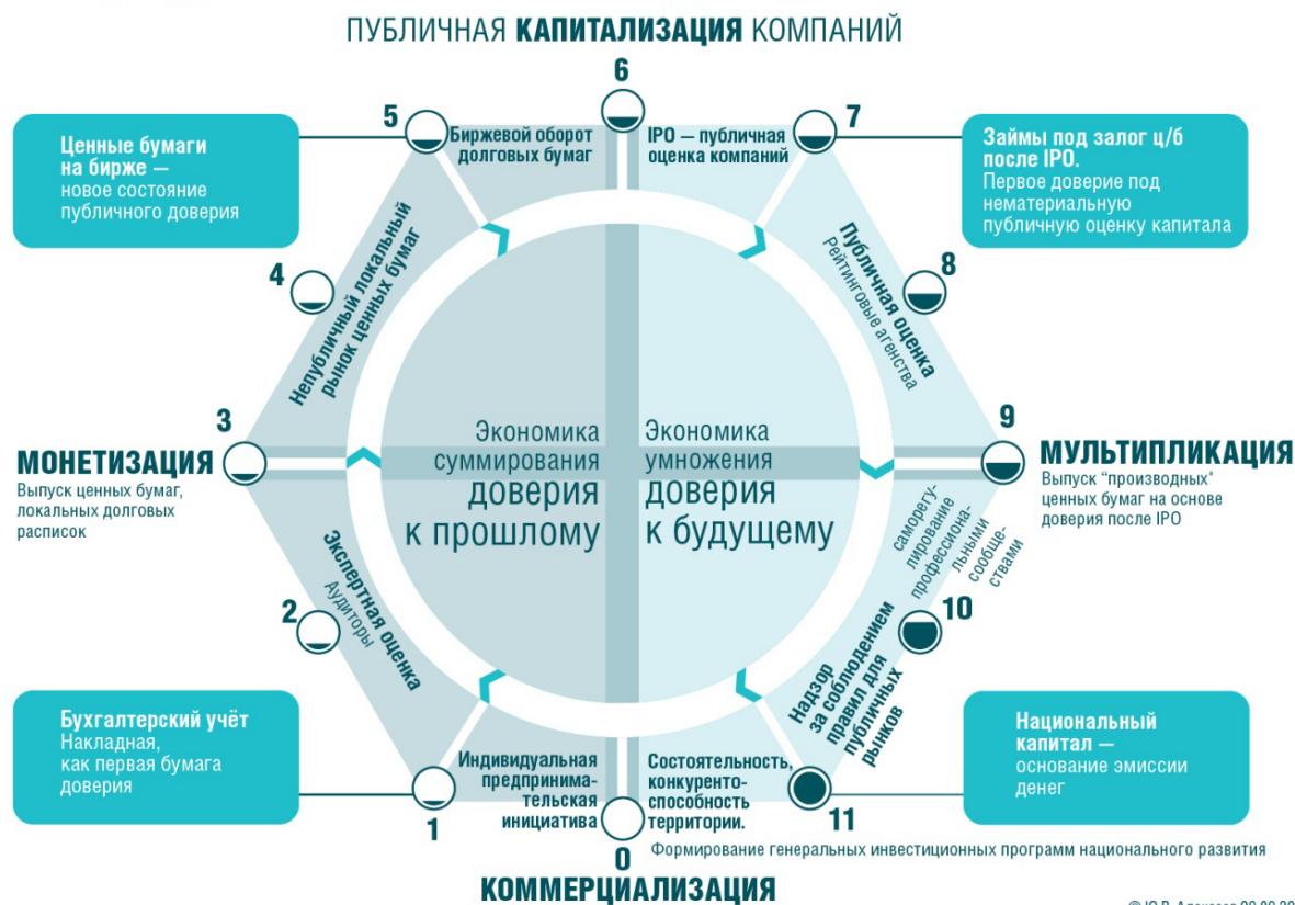
Рис. 1. Природа денег и их круговорот в экономике для гармоничного развития

Круговорот денег в экономике во многом близок к известным законам природы, подобно опорному кресту устройства мира. Ночь противостоит дню, рассвет противоположен закату. Зима противостоит лету, весна противоположна осени. Переход одного состояния природы в новое происходит по кругу. Например, круговорот воды в природе: после испарения воды образуются облака – новое газообразное состояние; при охлаждении и конденсации вода возвращается на землю в виде снега или дождя, образуя водоемы на земле; а затем снова испаряется из них или с поверхности земли, пройдя под землёй фильтрацию.