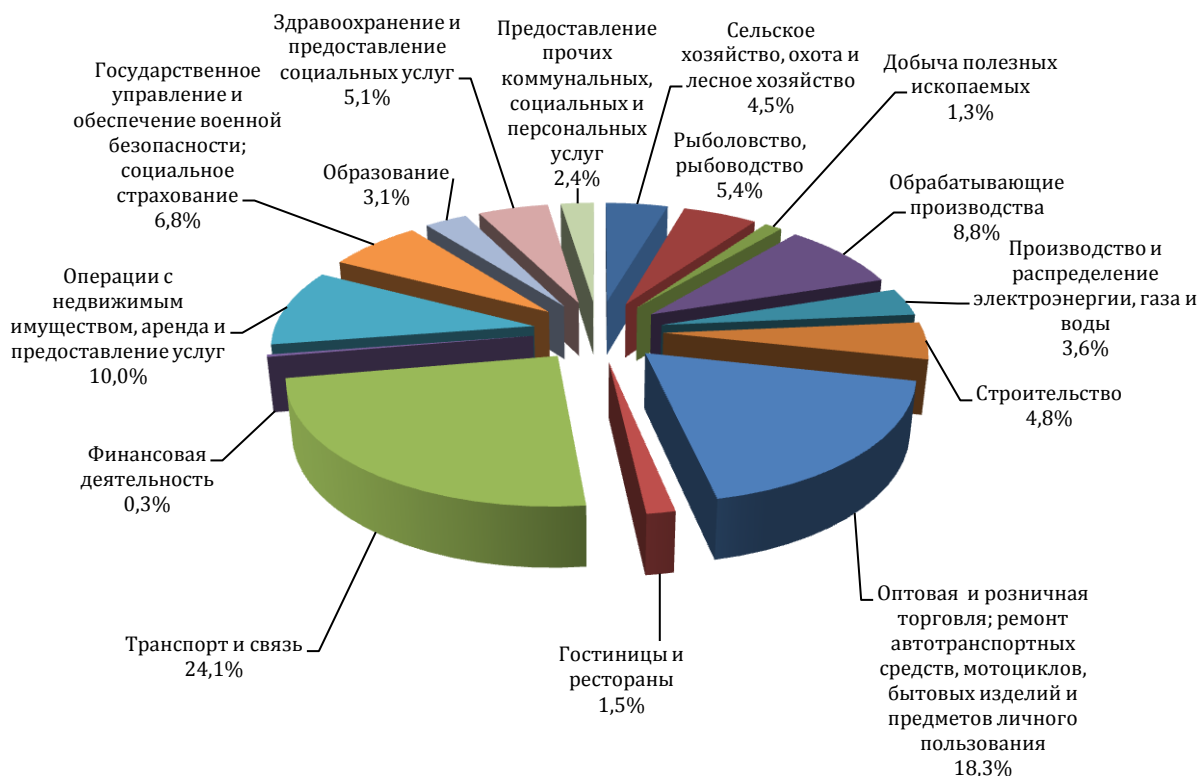
Рисунок 1.4.1. Структура валового регионального продукта Приморского края в 2016 г.

Треть валового регионального продукта Приморского края формируется за счет деятельности транспорта и обрабатывающих производств.