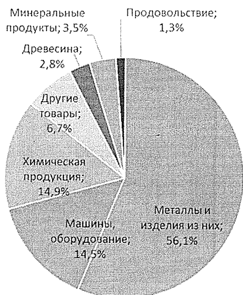
Рис. 3 Структура экспорта