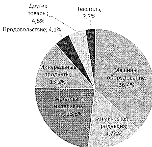
Рис. 4 Структура импорта

В качестве одного из приоритетных направлений государственной политики Российской Федерации по развитию и модернизации национальной экономики обозначена поддержка высокотехнологичного экспорта. К высокотехнологичной в соответствии с приказом Министерства промышленности и торговли российской федерации от 23.06.2017 № 1993 «Об утверждении Перечня высокотехнологичной продукции, работ и услуг с учетом приоритетных направлений модернизации российской экономики и перечня высокотехнологичной продукции» относится следующая продукция: