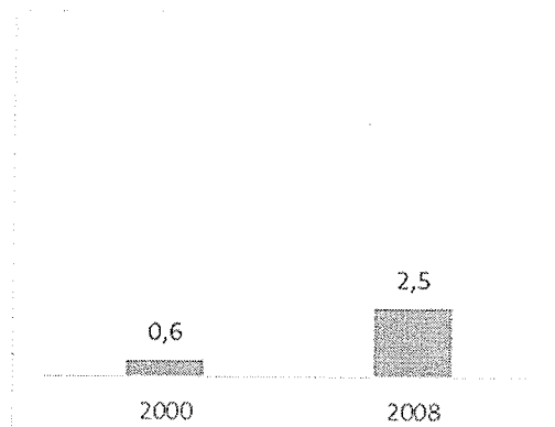
Рисунок 2. Рост импорта в 2000-2008 годах, млрд. долларов США

Конъюнктура мирового рынка в этот период благоприятствовала экспортерам металлопродукции. В середине 2008 года цены на черный прокат, медь и алюминий достигли своего пика, доля металлов в экспорте области достигла 62%, стоимостной объем увеличился в 4,2 раза. При этом доля экспорта химической продукции составляла 15% (стоимостные объемы выросли в 1,9 раза), доля машиностроения – 10% (стоимостные объемы выросли в 2,1 раза).