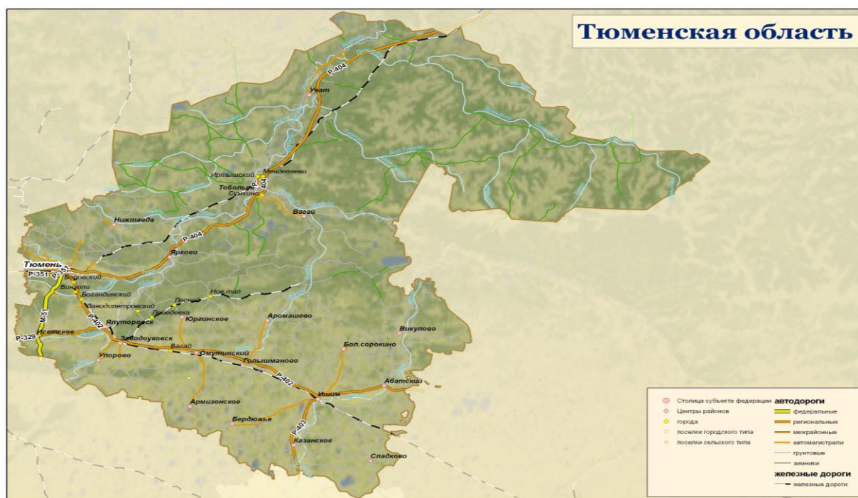
Рис.1.1. Тюменская область (без автономных округов)

Тюменская область входит в состав Уральского федерального округа (УФО) и располагается на юге Западной Сибири в бассейне реки Иртыш. Площадь территории Тюменской области (без автономных округов) составляет 160,1 тыс. кв. километров. По данному показателю регион занимает 4 место по Уральскому федеральному округу и 24 место по Российской Федерации. Численность населения области на начало 2008 года составляет 1325,4 тыс. человек (4 место по УФО и 38 место по Российской Федерации). С плотностью населения – 8,3 человек на кв. км Тюменская область занимает 4 место по УФО и 60 место по Российской Федерации.