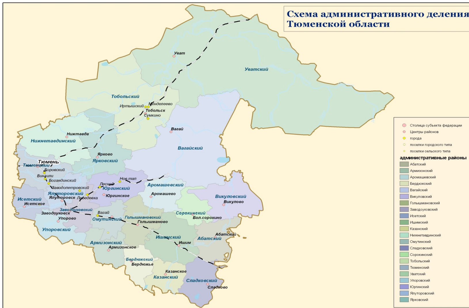
Рис.6.1. Административно-территориальное деление Тюменской области (без автономных округов)