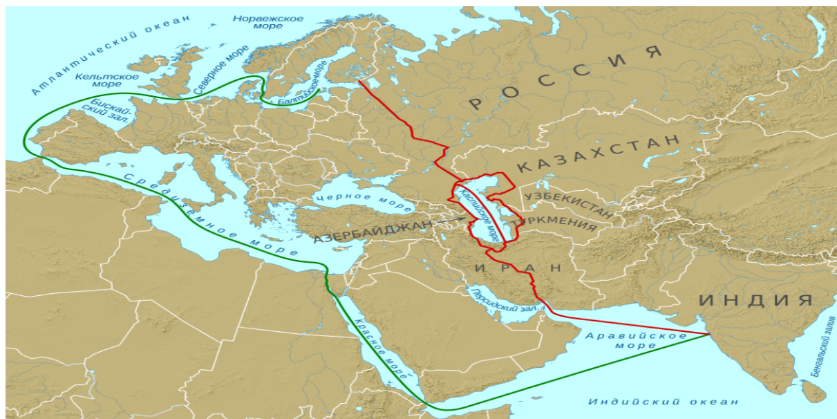
Рис. __Международный транспортный коридор «Север-Юг»

Международный транспортный коридор «Север-Юг» (МТК «Север-Юг») – мультимодальный маршрут транспортировки пассажиров и грузов, общей протяженностью от Санкт-Петербурга до порта Мумбаи (Бомбей) 7200 км. Он создан для привлечения транзитных грузопотоков из Индии, Ирана и других стран Персидского залива на российскую территорию (в том числе через Каспийское море), и далее в Северную и Западную Европу.