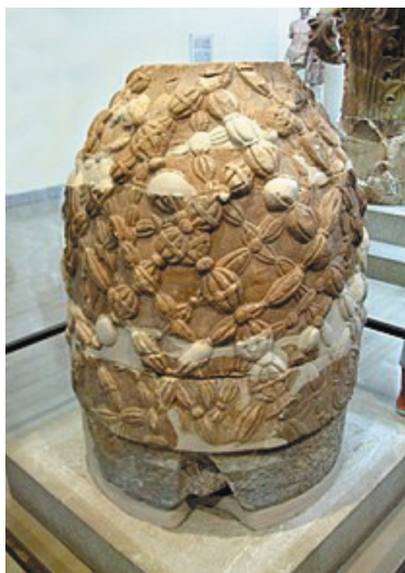
Рис. 2. Омфал в археологическом музее в Дельфах

«Круговой культ» контринициаций создавался как, одновременно, символический антагонист и нарциссическое подражание религиям «чистого опыта» и особенно — инициатическим практикам совершенного человека, с элементами прямых культовых заимствований из ведических культур и индуизма, частично античных мистерий и множества архаических ритуалов. Практически все культовые формы контринициаций за столетия их существования сохранялись как омфалоподобные (как варианта пирамидоподобия) сети и иерархии . В современную эпоху эти формы хорошо различимы у всех так называемых деструктивных и оккультных сект , у практически всех закрытых элитных сообществ, включая трансперсональные сообщества, в которые трансформировалась основная масса контринициаций.