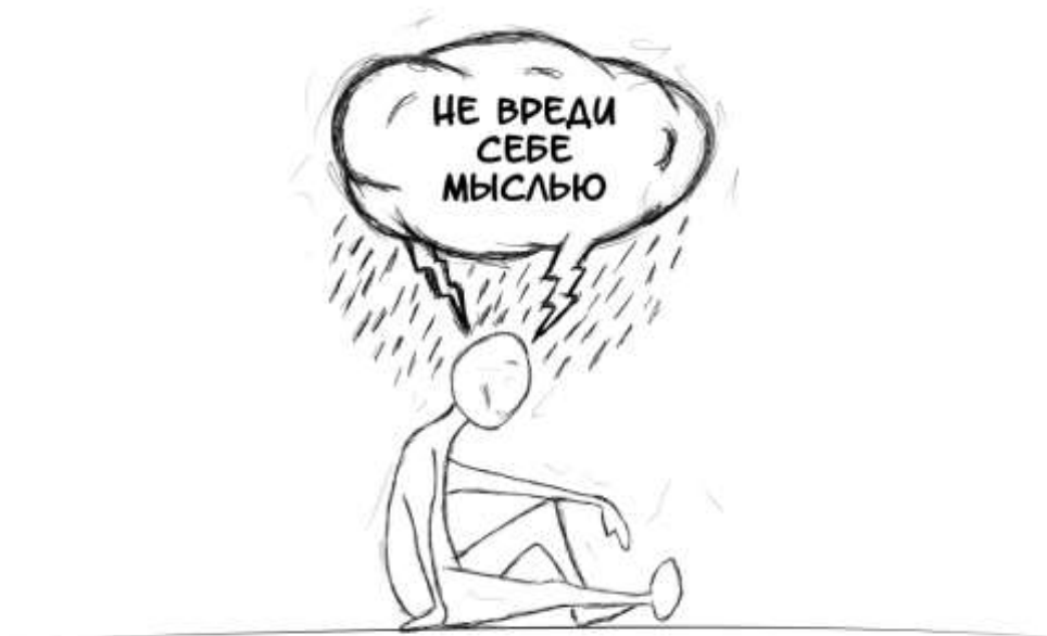
Рисунок 1. С1-М «Не вреди себе мыслью»