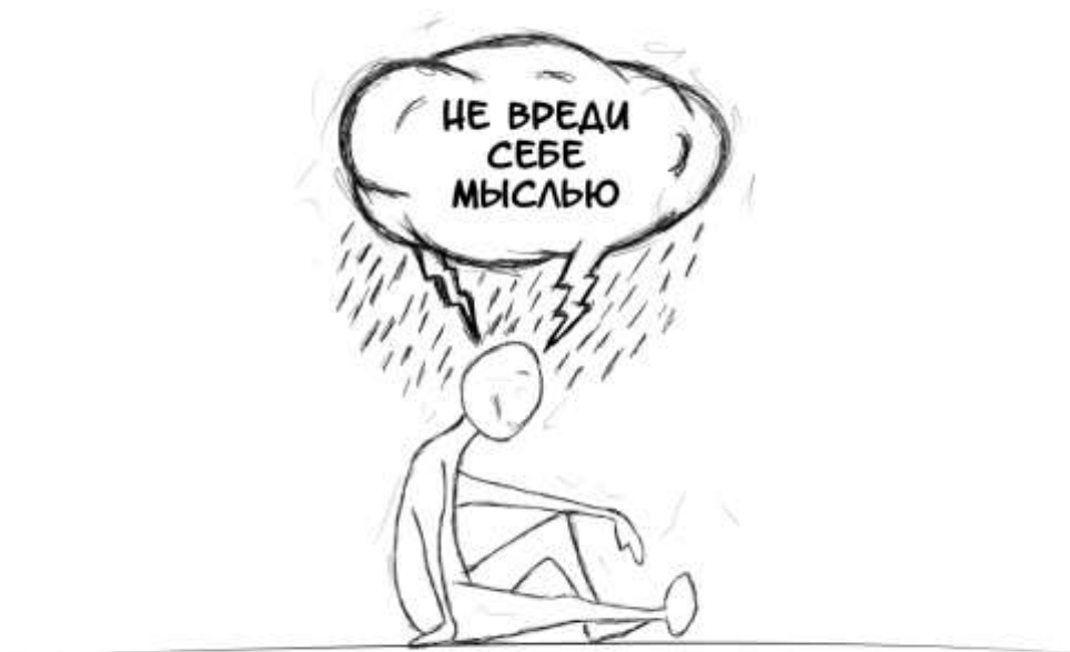
Рисунок 1. С1-М «Не вреди себе мыслью»