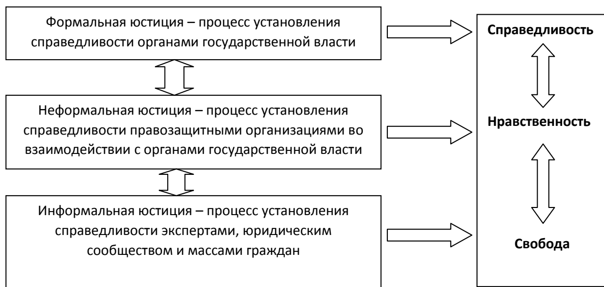
Рис. 1. Информальная юстиция – нравственный балансир свободы и справедливости

нравственных и правовых позиций: не причинить вреда, следовать духу, а не букве закона.