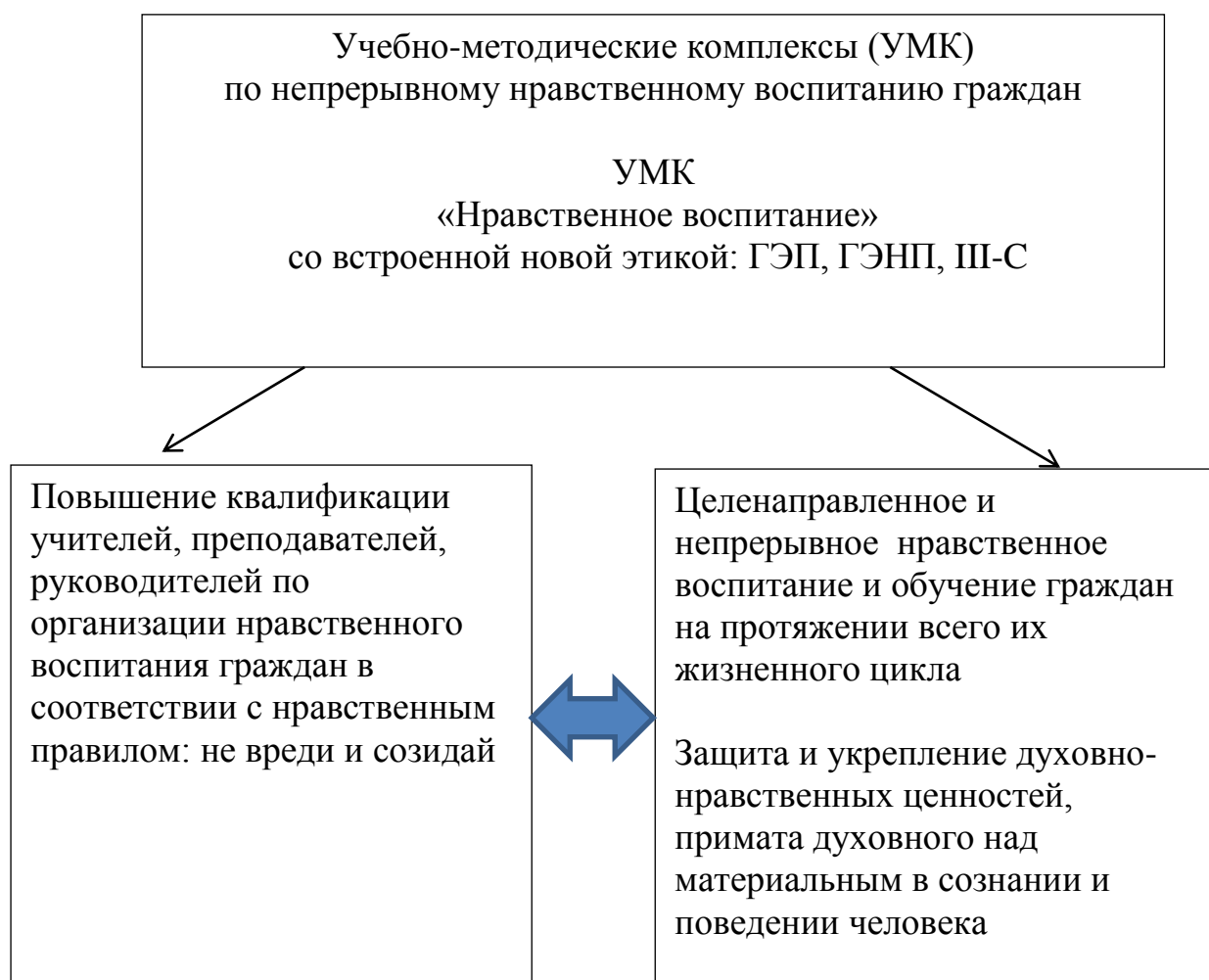
Рис. 2. Функция нравственного воспитания граждан, обеспечивающего формирование нравственного гражданина

организаций, исключаящие причинение вреда гражданам и среде их обитания.