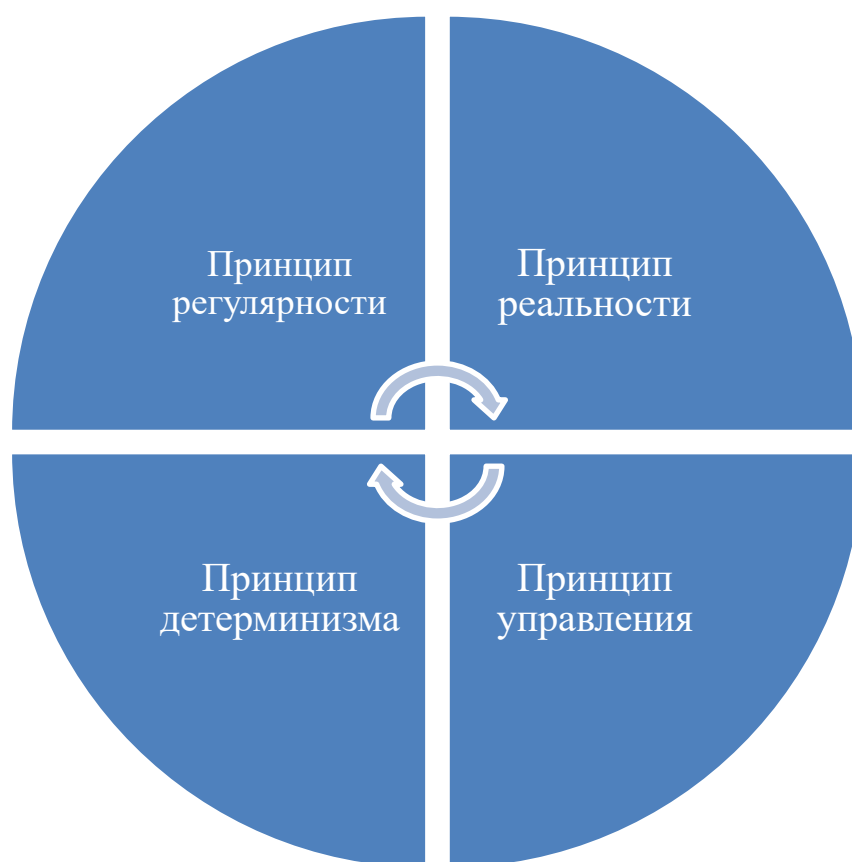
Рисунок 1. Принципы

Из вышеперечисленного перечня принципов я считаю, что для формирования моей авторской модели требуется выделить четыре ключевых принципа, а именно: