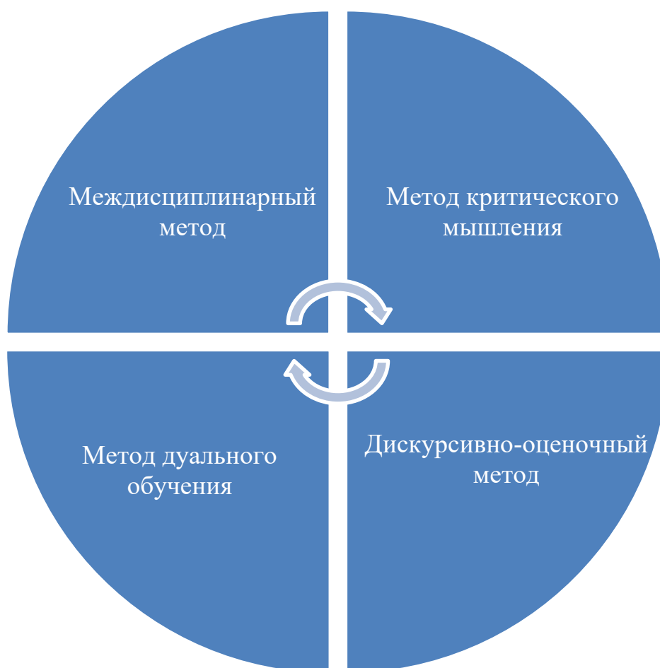
Рисунок 2. Методы

Процессные, проектные и смешанные подходы практико-ориентированного обучения по моему мнению определяют четыре основных метода в общей методологии.