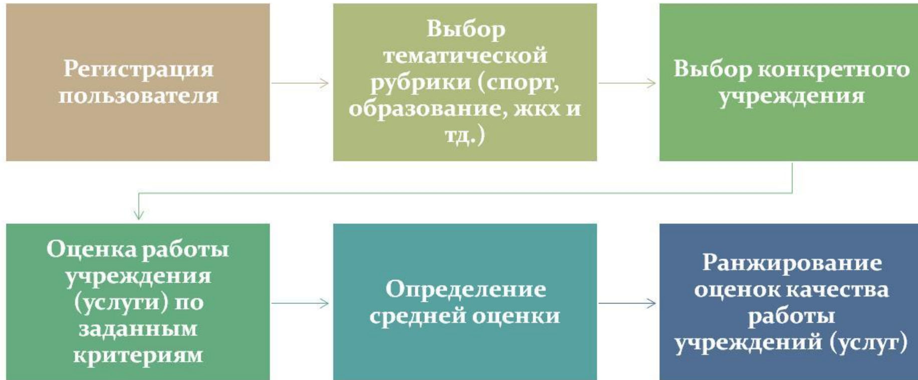
Схема работы сайта

СОЗДАНИЕ ИНТЕРНЕТ-СЕРВИСА, ПОЗВОЛЯЮЩЕГО ПРОИЗВОДИТЬ МОНИТОРИНГ ОТДЕЛЬНЫХ КЛЮЧЕВЫХ ПОКАЗАТЕЛЕЙ