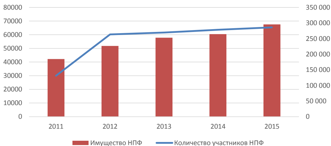
Рисунок 1 – Динамика основных показателей НПФ Ханты-Мансийского автономного округа – Югры (по НПФ, существующим по состоянию на май 2016 года) (данные Банка России)

Оба рассматриваемые НПФ в целом сохраняют свои позиции (с учетом того, что НПФ «Сургутнефтегаз» прошел через реорганизацию) – основные показатели демонстрируют положительную динамику на протяжении всех последних лет.